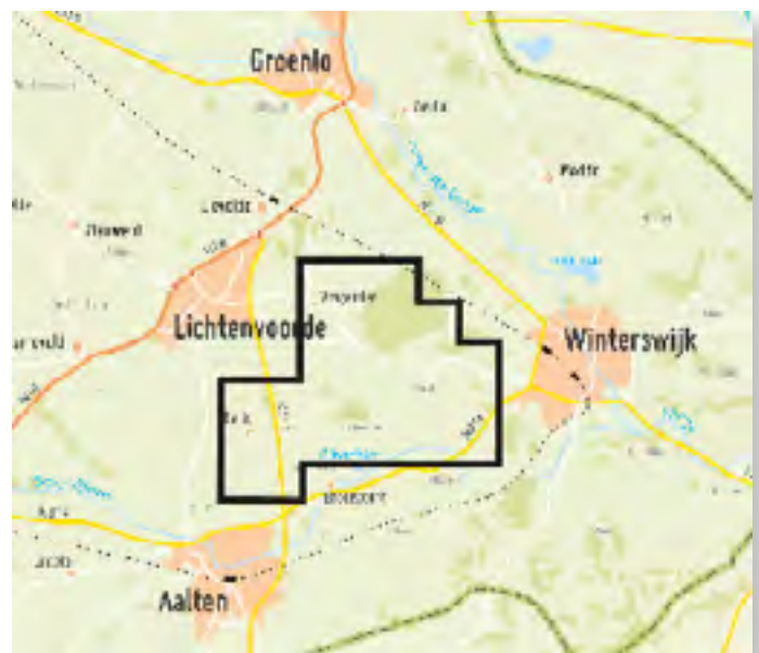
Kaart: Onderzoeksgebied pilot basiskwaliteit