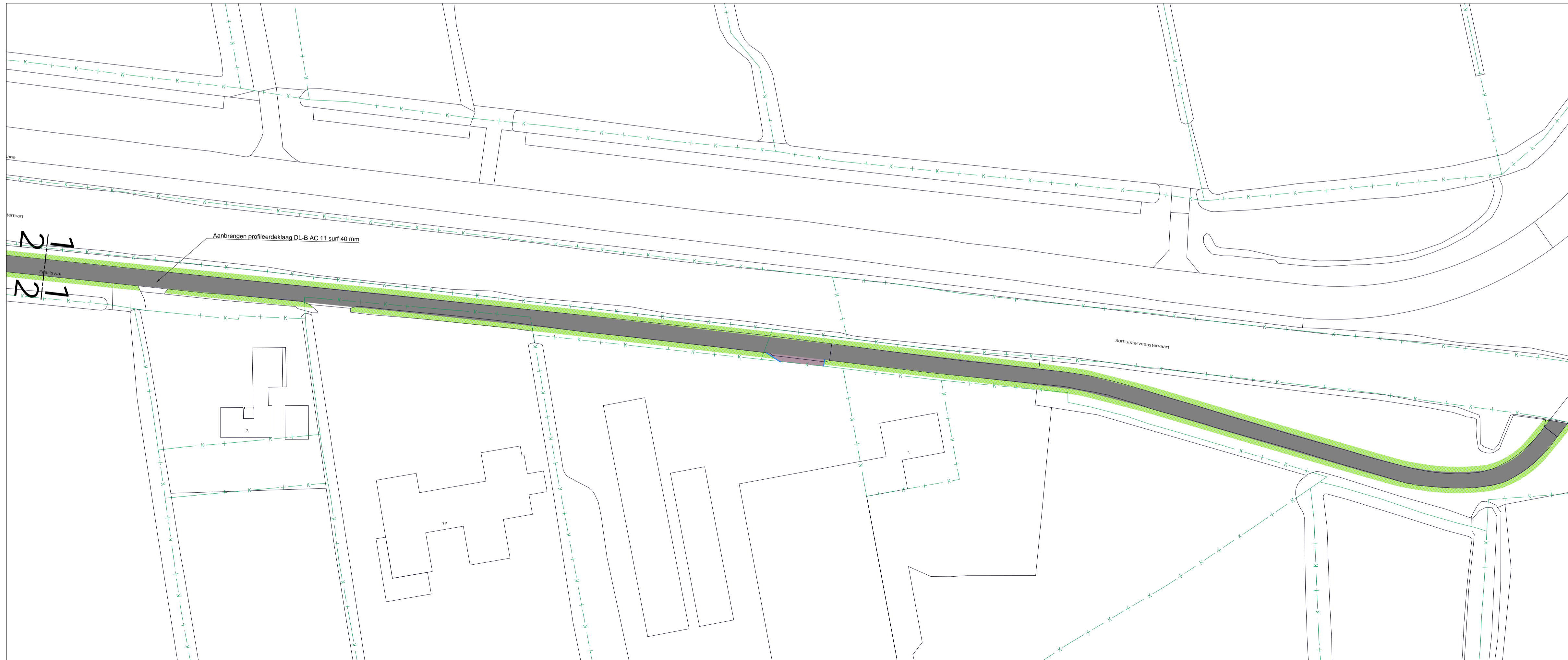
Situatie met ontwerp