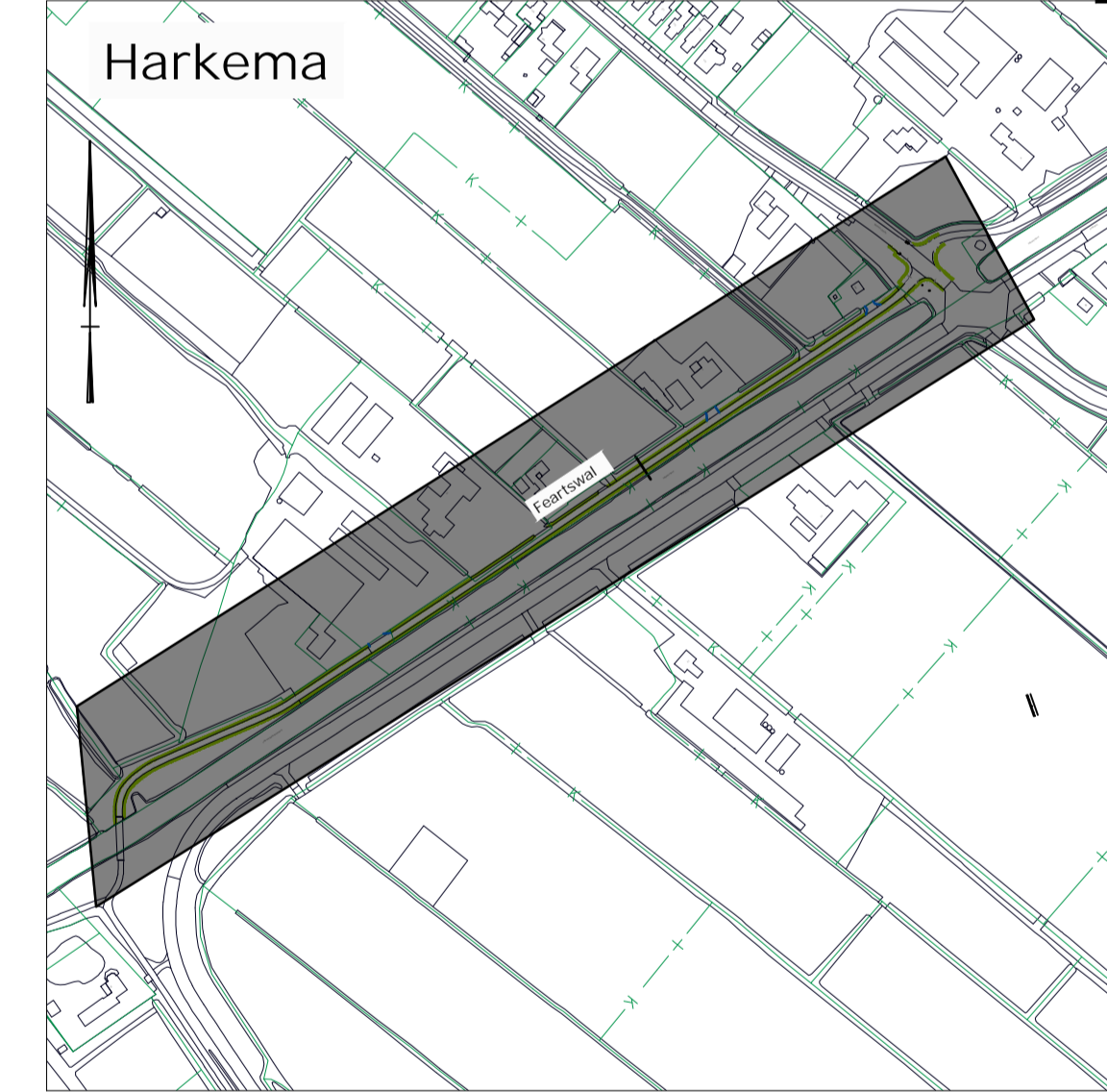
Overzicht situatie schaal 1: 5000