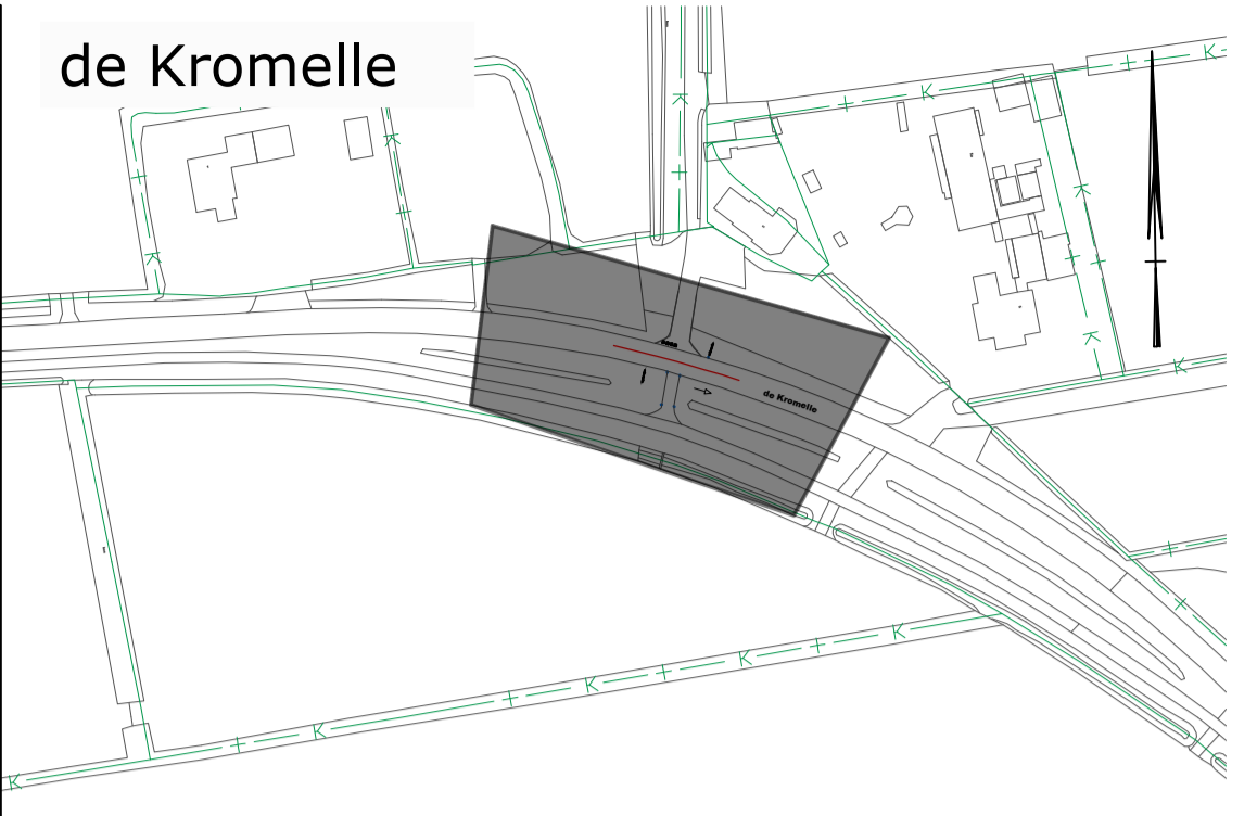
Overzicht situatie schaal 1:2000