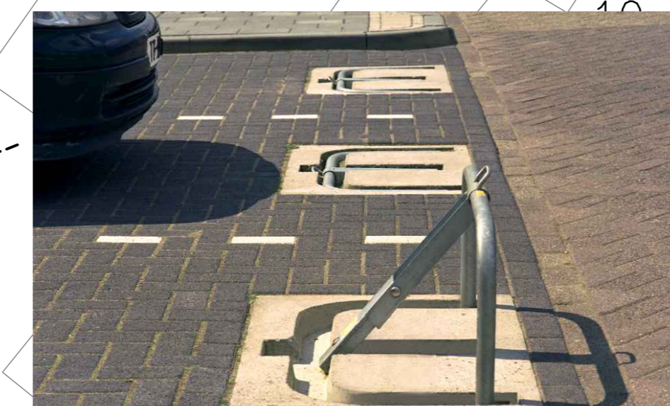
Parkeervakken op Jumbo terrein (9 st.) voorzien van parkeerbeugels n.a.v. geluidsonderzoek