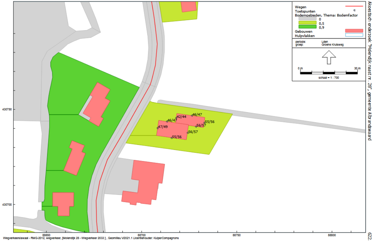
Bijlage 3: Geluidsbelasting tgv Groene Kruisweg De resultaten zijn NIET gereduceerd ex artikel 110g Wgh

Akoeistich onderzoek 'Molendijk' naast tr. '28', gemeente Albrandswaard G22.119.00