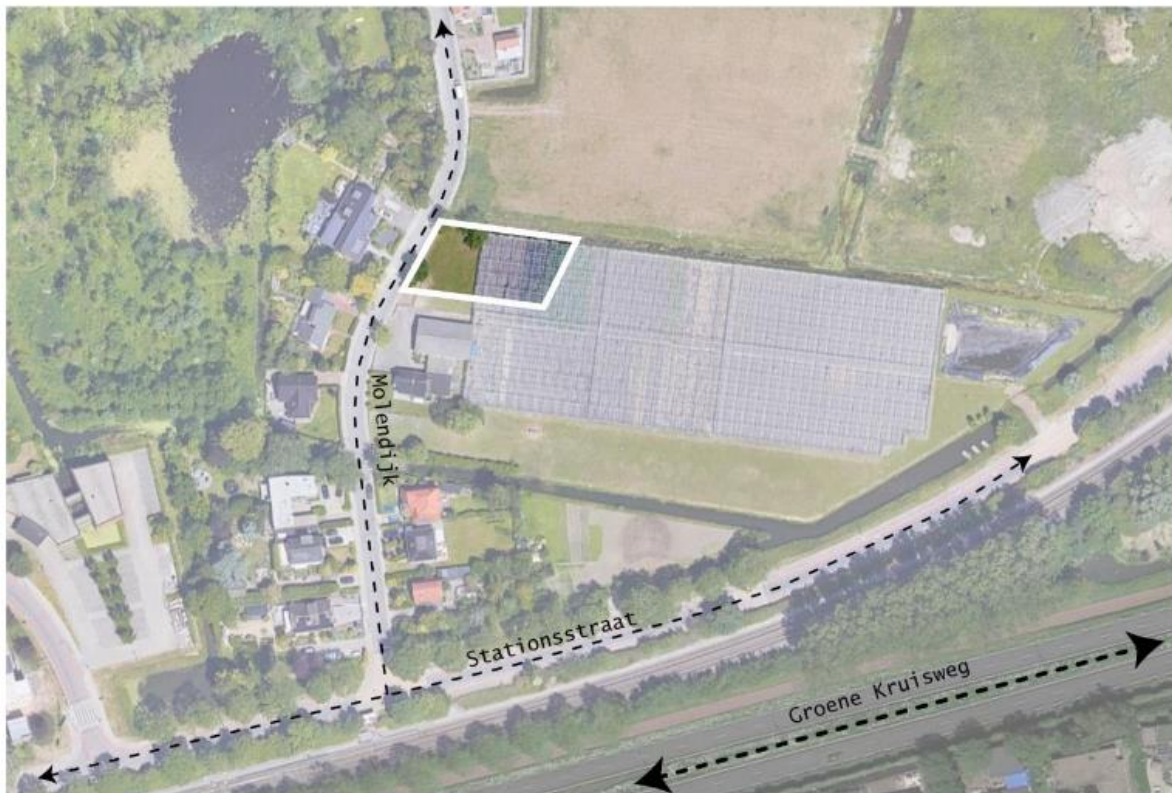
Figuur 1: Weergave van de planlocatie

De omgevingsvergunning Molendijk naast nr. 28 maakt het mogelijk om een woning te realiseren ter vervanging van reeds gesloopte kassen. De globale begrenzing van de planlocatie is in de navolgende afbeelding weergegeven.