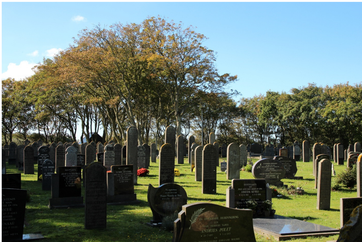
Afb. 4 Behoud van de karakteristieke slanke stèles is een doel dat met het huidige beleid en juridische regels nagestreefd wordt.

De toelichting op de verordening en de nadere regels kan gebruikt worden als input voor een tekst voor de rechthebbenden, naast de geplande voorlichting over dit onderwerp.