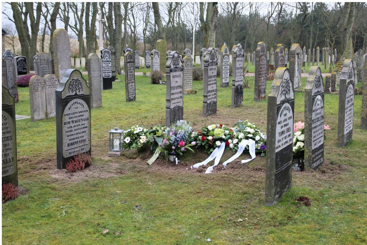
Afb. 1 Dit blijft zo nu en dan het beeld op de begraafplaatsen. Vraag is wel wat voor soort grafmonument er dan hier geplaatst kan worden.

In de volgende hoofdstukken wordt het in dit hoofdstuk geformuleerde uitgangspunt telkens opnieuw gehanteerd en waar nodig nader uitgewerkt. Dat zal zeker met betrekking tot mogelijke nieuwe vormen van lijkbezorging tot nieuwe beleidsuitgangspunten leiden. De visie sluit immers nieuwe ontwikkelingen niet uit. Zo is het plaatsen van urnenmuren een ontwikkeling die verderop verder uitgewerkt wordt. De gevolgen hiervan worden in beleid en juridische regels uitgewerkt.