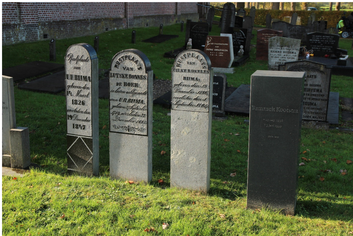
Afb. 5 Inpassing van nieuwe grafmonumenten zoals hier op het kerkhof van Ureterp zijn niet altijd subtiel, maar passen mogelijk wel in het karakter door vorm en materiaalgebruik.

Het is de vraag hoe binnen de zonering omgegaan kan worden met grafmonumenten. Hiertoe worden nadere regels opgesteld.