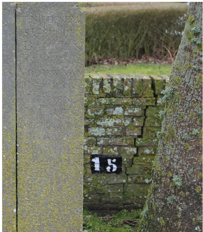
Afb. 6 Breuk zoals hier, dient periodiek aangepakt te worden.

De regelnummers die op sommige muren voorkomen, dienen behouden te blijven.