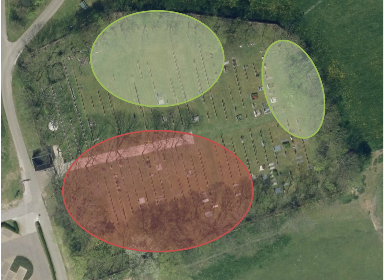
Afb. 2 Voorstel tot zonerings op de begraafplaats in Nes.