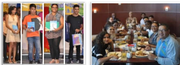
Finalisten ADV ABC 2017 deelnemers Aruba