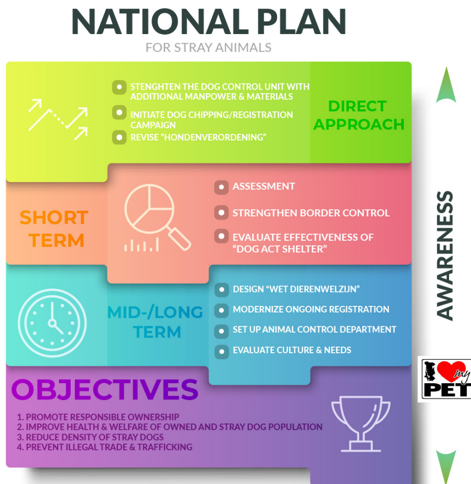
Figuur 2: NPSA

In onderstaand figuur is er schematisch het aangepaste plan van aanpak weergegeven.