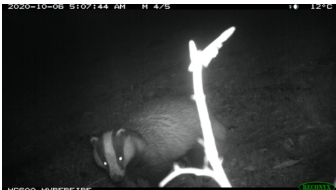
Das op kwekerij 10 juni 2020

Greenwashing. “Het streven is de kwekerij middels een ecologisch harmonieus ontwerp weer een rol te geven in het functioneren van het landgoed en verbindingen naar de andere delen van het natuurnetwerk. Toch grappig: de volgende dieren laten zien dat die verbindingen er al lang zijn en dat de kwekerij en NNN één geheel vormen: