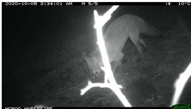
Vos op kwekerij op 9 juni 2020

Mooie kletspraat van Eelerwoude. Onzin wat zij schrijven: de kwekerij is een belangrijk onderdeel van het foerageergebied van o.a. dassen, konijnen en vossen.