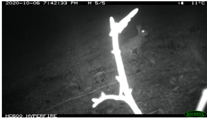
Konijn op kwekerij op 6 juni 2020