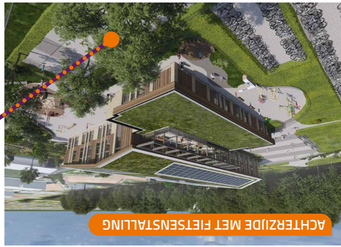
ACHTERZIJDE MET FIETSENSTALLING