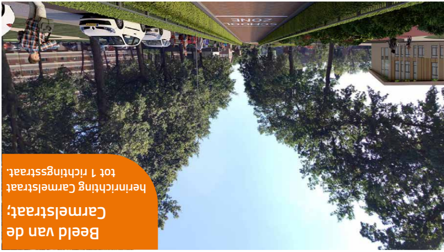
Beeld van de Carmelstrat; herinrichting Carmelstrat tot 1 richtingsstrat