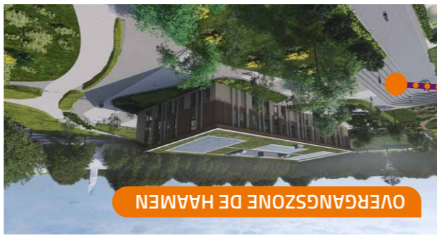
OVERGANGSZONE DE HAAMEN