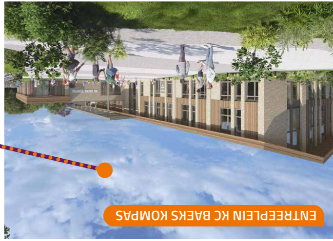
ENTREEPLEIN KC BAEKS KOMPAS