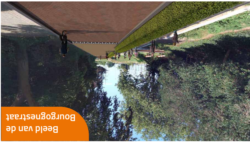
Beeld van de Bourgnestrat