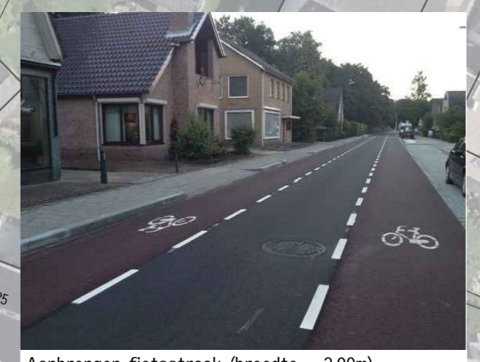
Aanbrengen fietsstrook (breedte = 2,00m) Uitvoering in rode coating inclusief fietssymbolen en onderbroken lengtemarkering 1-1 van thermoplast