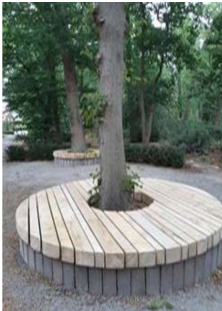
Impressie maatregelen Brouwersbos

Het Brouwersbos is vanaf 2018 gefaseerd heringericht met kleinschalige maatregelen. Hierbij is het bos overzichtelijker en veiliger gemaakt en zijn op een aantal plekken elementen toegevoegd die verwijzen naar de historie van het bos. Het nodigt nu nog meer uit om te wandelen met nieuwe elementen die het ontmoeten versterken. Het krediet heeft een lichte overschrijding van € 2.000.