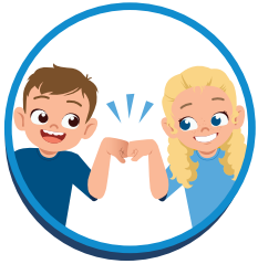
Vriendelijk en aardig tegen elkaar.