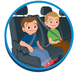
Recht op de stoel.

Van alle kinderen verwachten wij dat zij: