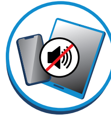
Geluid staat uit.