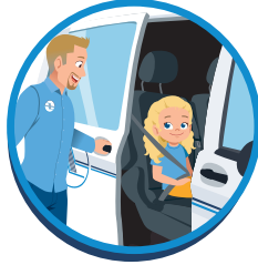
Chauffeur opent en sluit de deur.