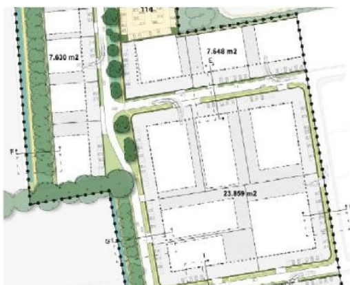
Figuur 1: Illustratie losse bedrijfsgebouwen/afstanden perceelsgrens