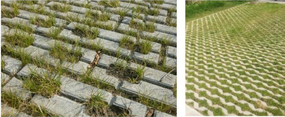
Figuur 5: Referentie bestrating inritten