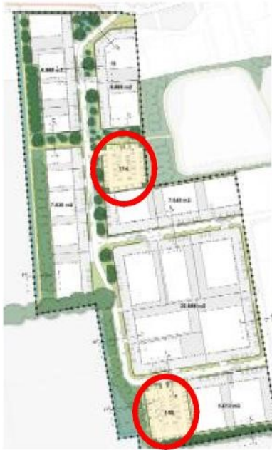
Figuur 3: Locatie openbare parkeervelden

Deze parkeerplaatsen worden in mindering gebracht op het aantal op eigen terrein te realiseren parkeerplaatsen. U kunt deze parkeerplaatsen echter niet 'claimen' en zijn door iedereen te gebruiken.