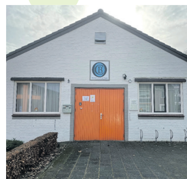
In Ontmoetingscentrum Bergen aan de Murseltseweg is voor de eerste keer een stembureau.