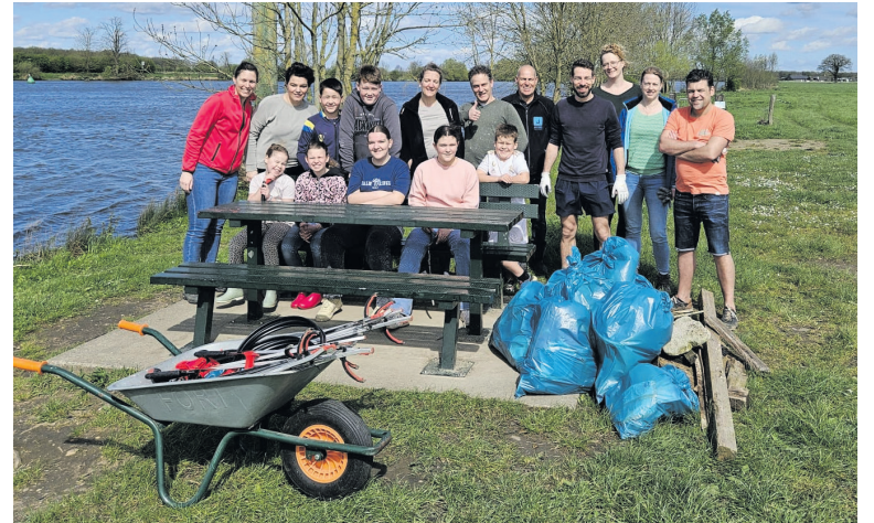
Volleybalvereniging Montagnards heeft zondag 7 april een deel van Maasoever in onze gemeente opgeruimd.