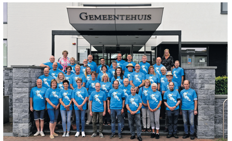
In 2023 haalden ruim 40 Vierdaagse lopers het unieke T-shirt op.

U kunt het T-shirt ook dit jaar weer ophalen tijdens de bijeenkomst voor Vierdaagse lopers uit de