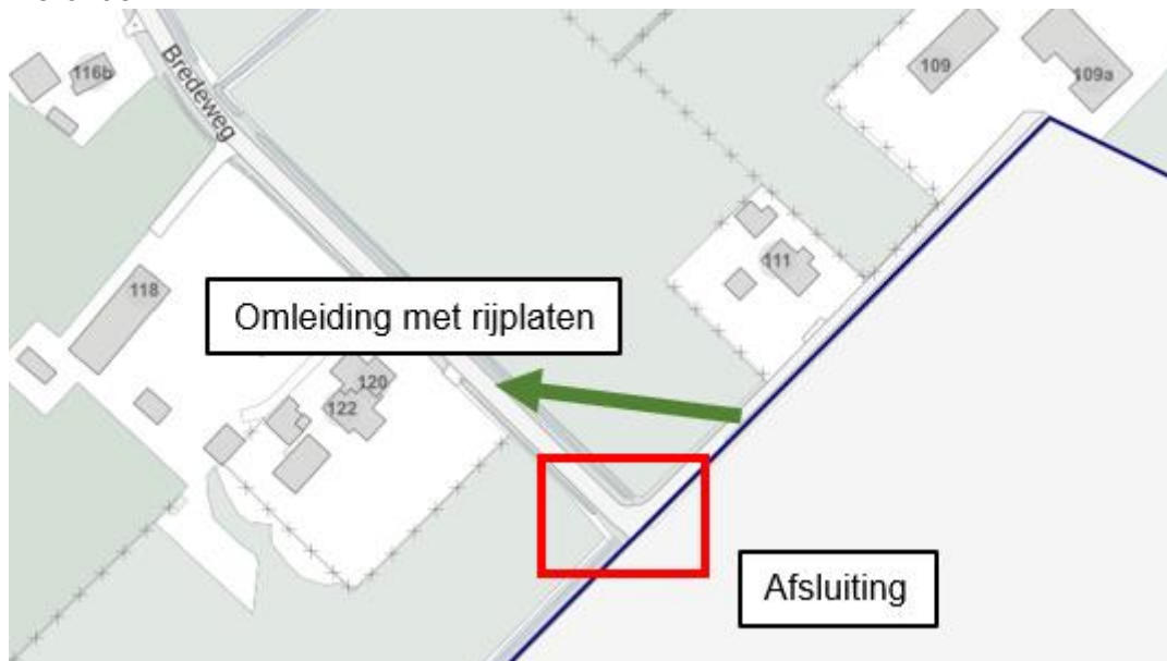
Afbeelding afsluiting bij de grensovergang

De adressen van de Dierenkliniek De Aam en Bredeweg 109a en 111 blijven bereikbaar door rijplaten over het maisveld. Dit is aangegeven met de groene pijl in de afbeelding hieronder.