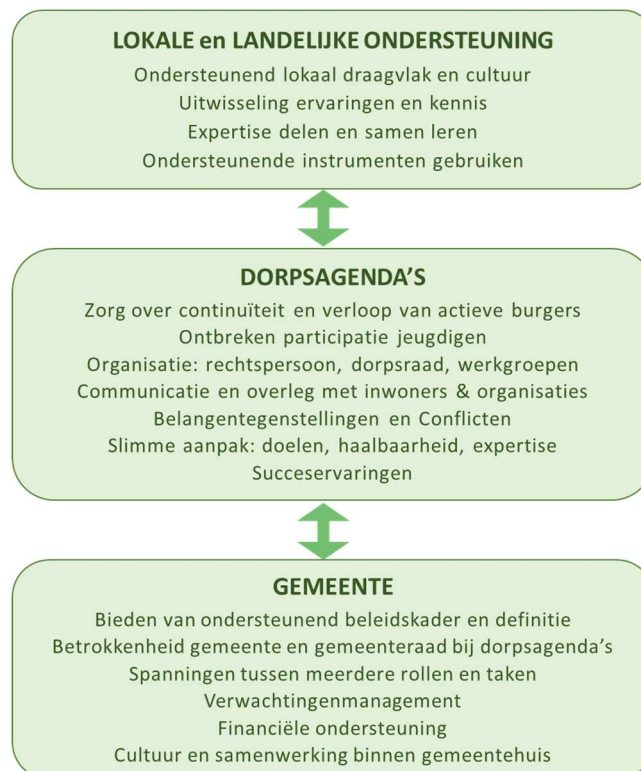
Figuur 7 Overzicht knelpunten en succesfactoren

In dit hoofdstuk hebben we de belangrijkste knelpunten en succesfactoren bij dorpsagenda's besproken die we hebben gevonden in onze interviews met een aantal burgers, gemeente-ambtenaren en Forte Welzijn. We hebben daar ook inzichten aan toegevoegd uit onze landelijke