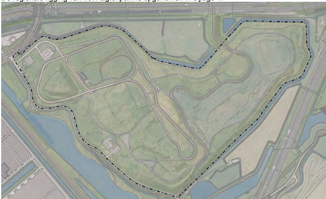
Figuur 1.1 Locatie Aagtenpark Beverwijk

De regionale ligging van het Aagtenpark is opgenomen in bijlage 1.