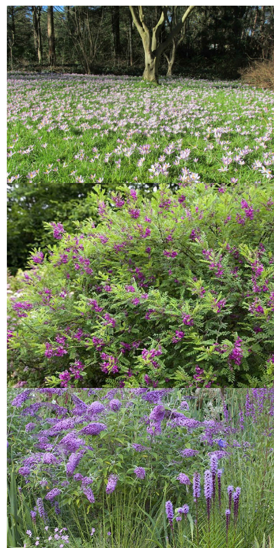
Kleuraccenten door bloembollen en bloeiende heestergroepen.