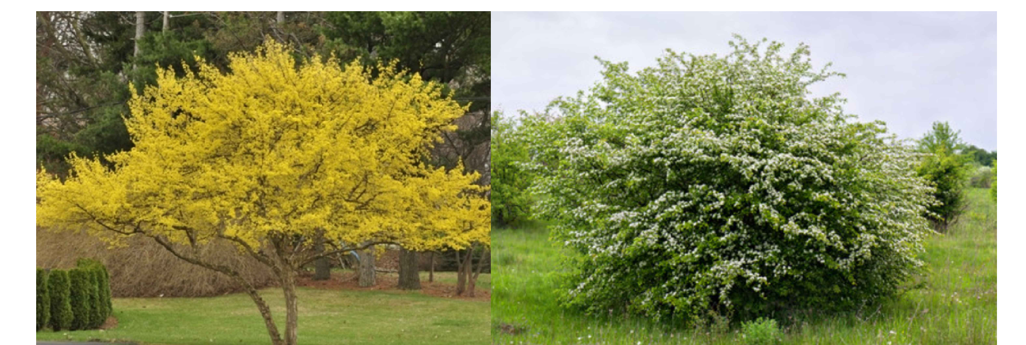
Op strategische plekken worden solitaire struiken geplant (Kornoelje, Meidoorn)