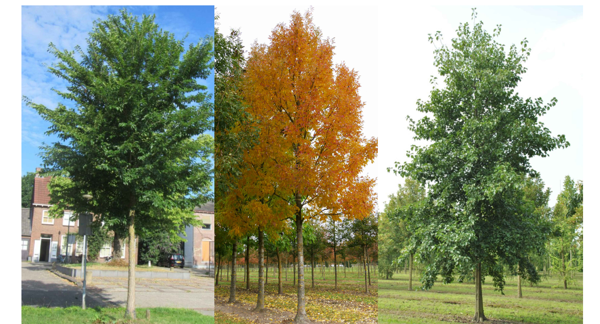
Het ruggengraat van de hoofdgroenstructuur bestaat uit grote bomen. De hoofdsorten zijn essen, iepen en elzen.