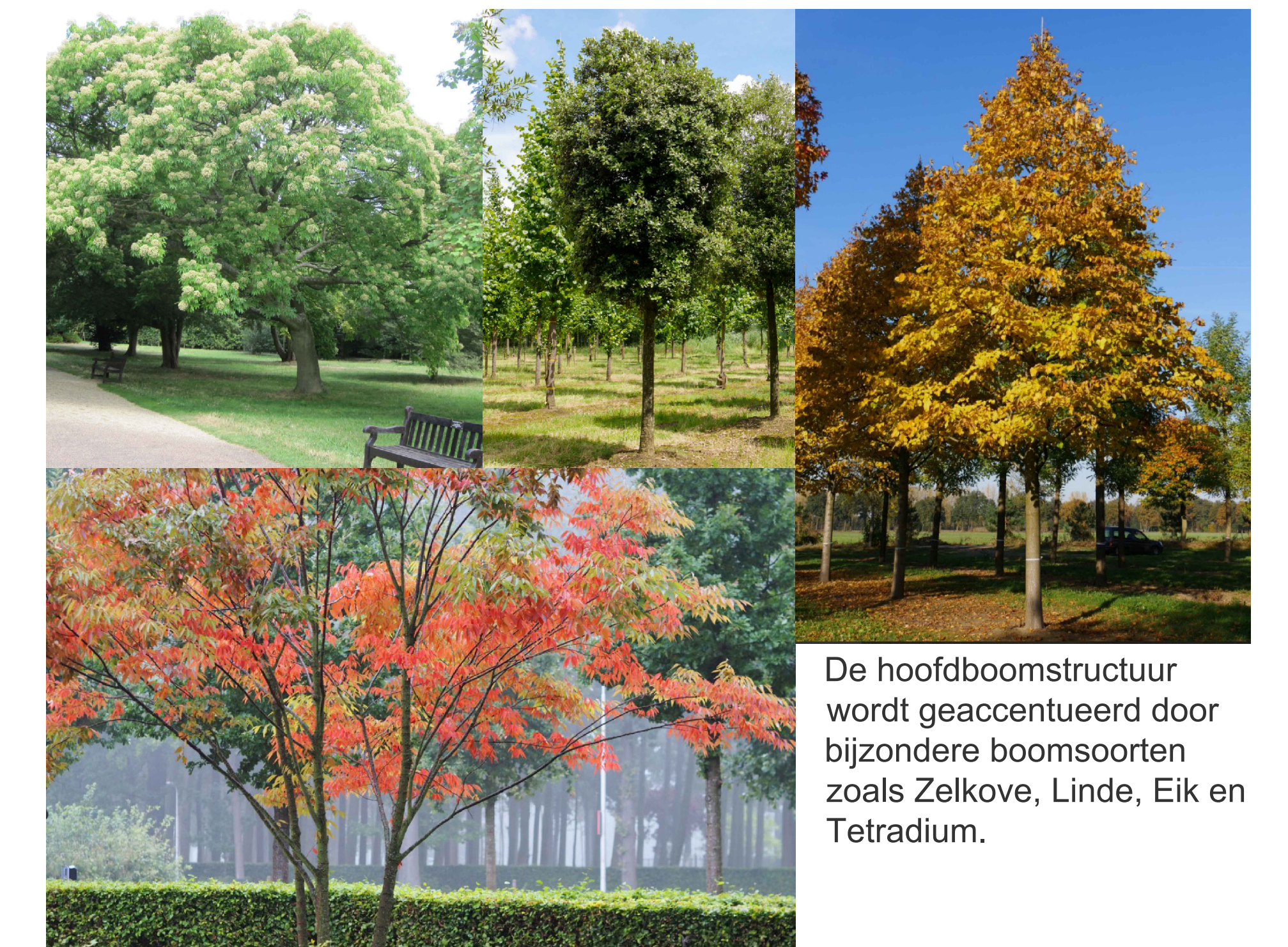
De hoofdboomstructuur wordt geaccentueerd door bijzondere boomsoorten zoals Zelkove, Linde, Eik en Tetradium.