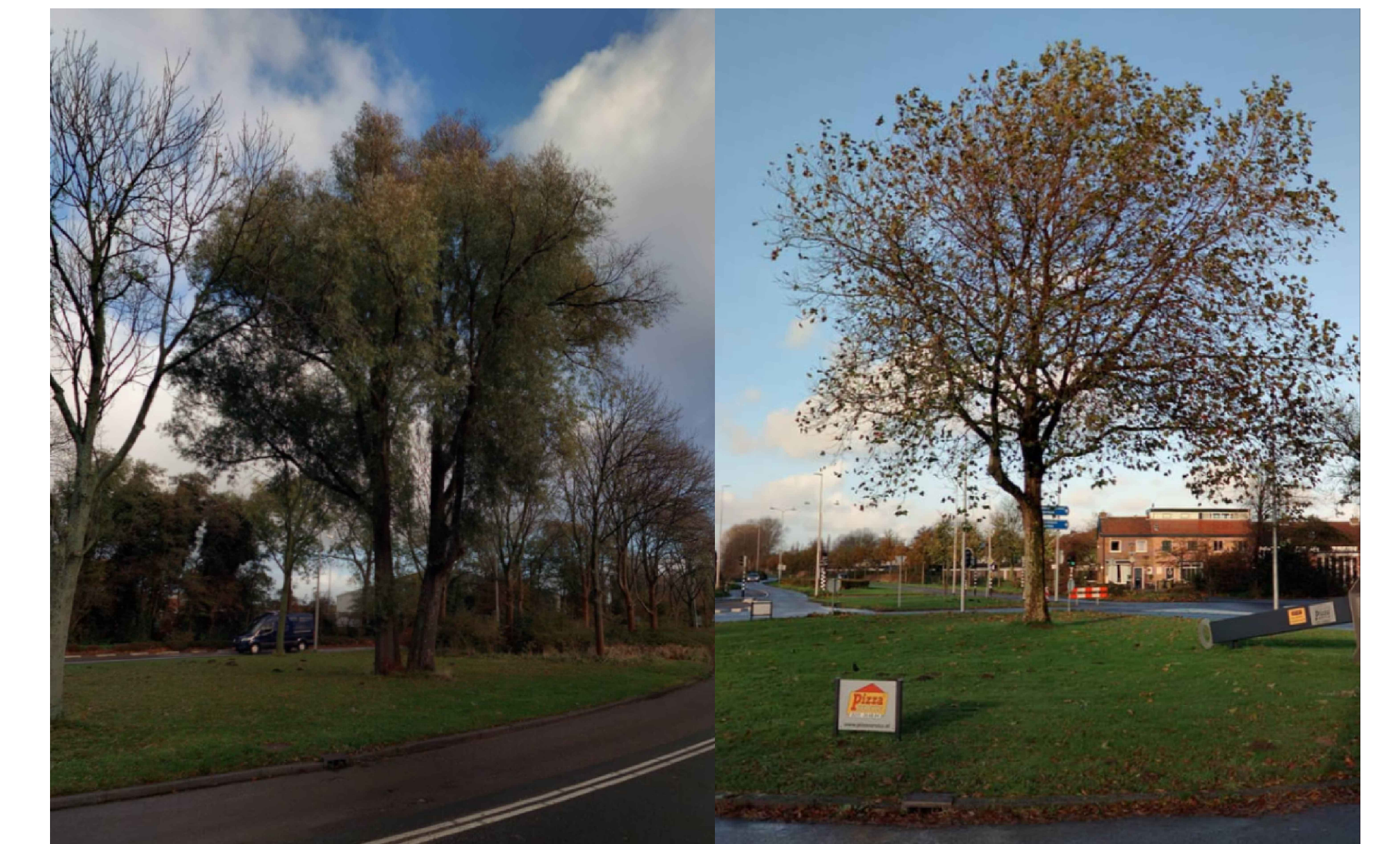
Bestaande bomen blijven zo veel mogelijk behouden. De grote boom (rechts) komt in het midden van de toekomstige rotonde te staan.