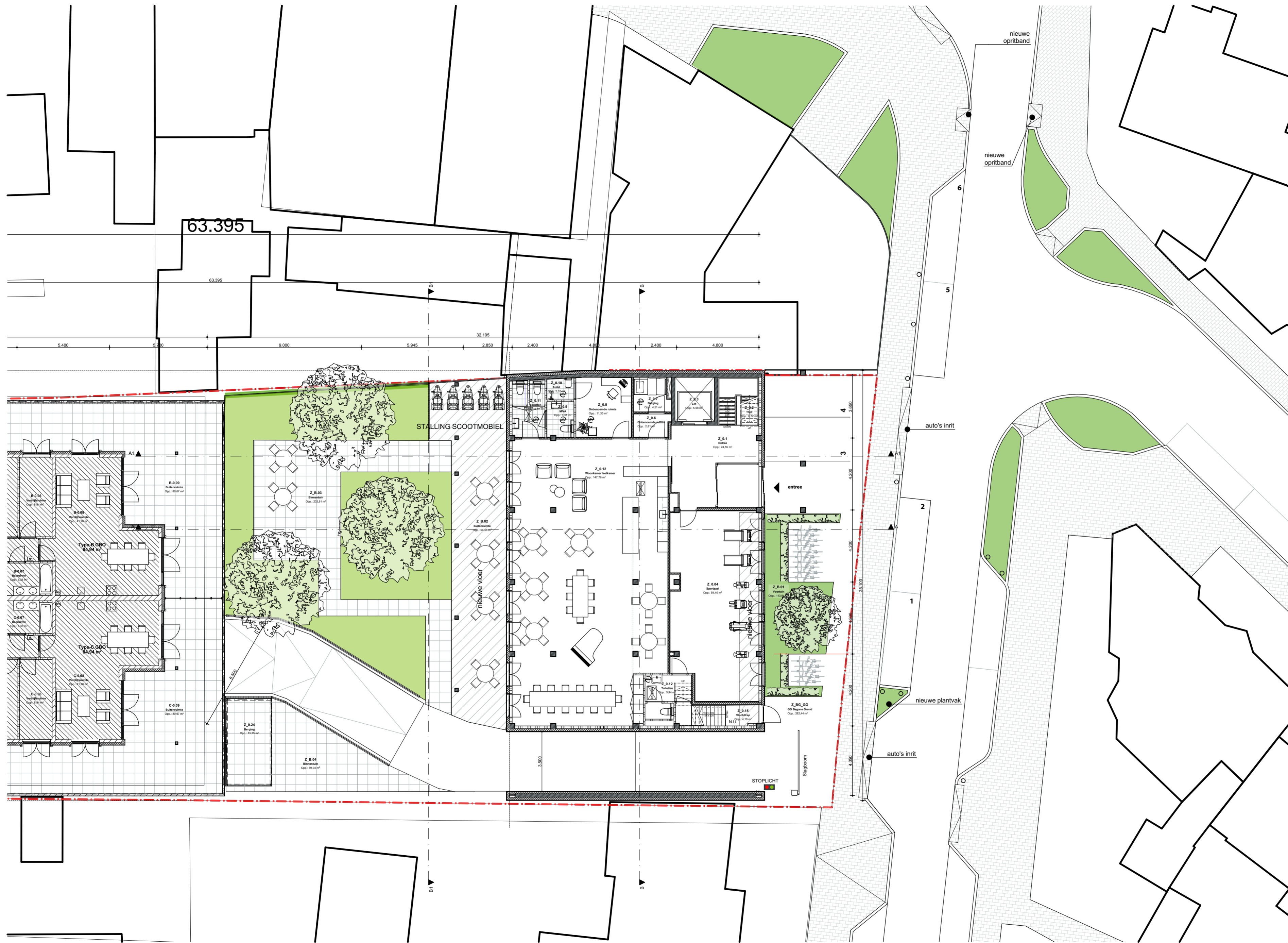
begane grond Nieuwe toestand