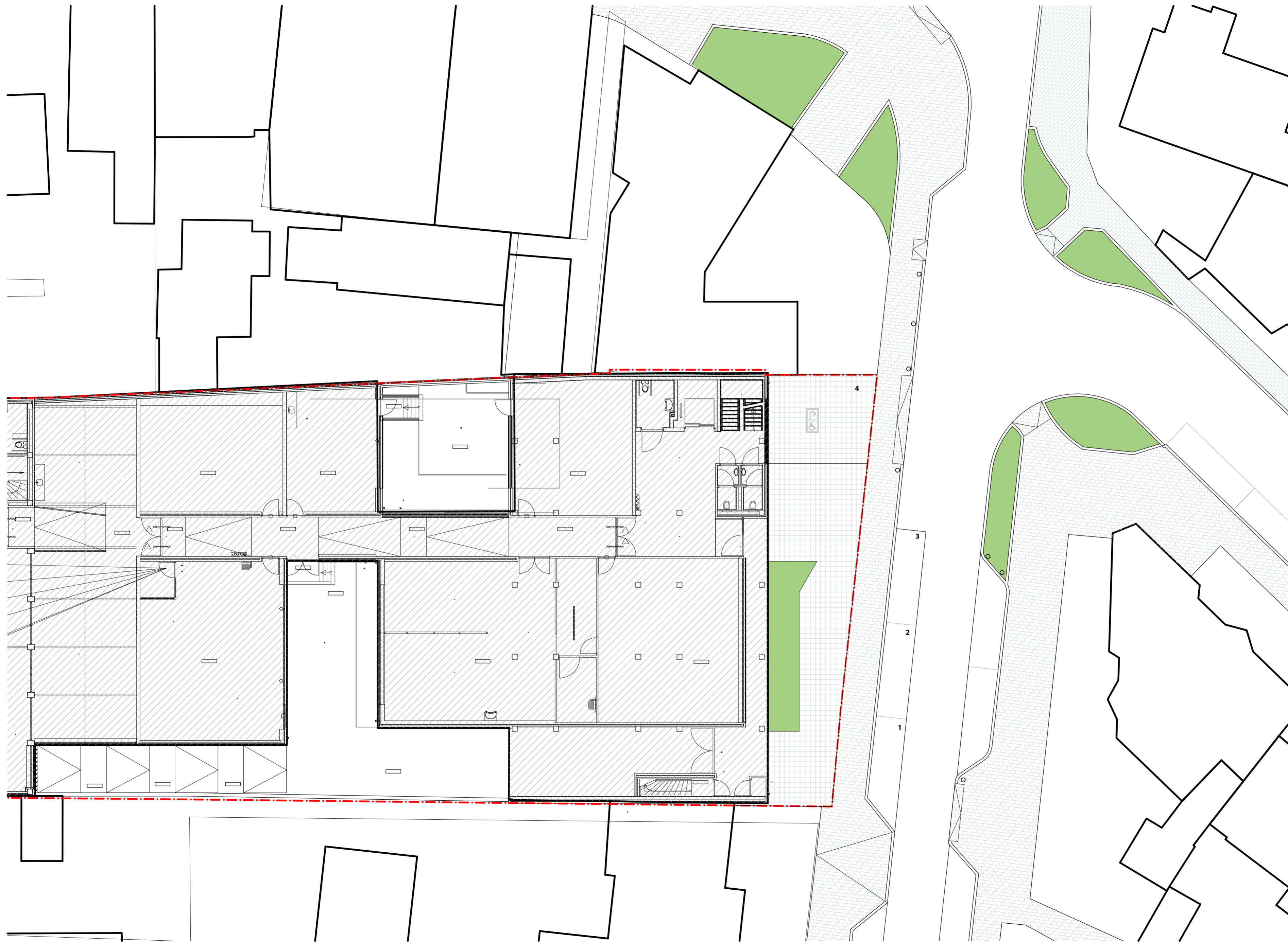
begane grond Bestaande toestand