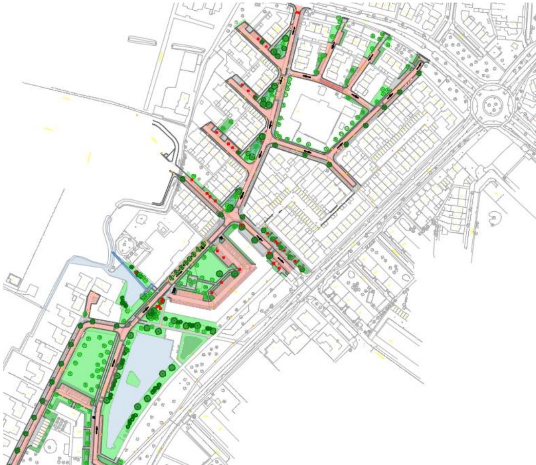
Bomen Haagdoornhof, Hazelaarhof, Ligusterhof