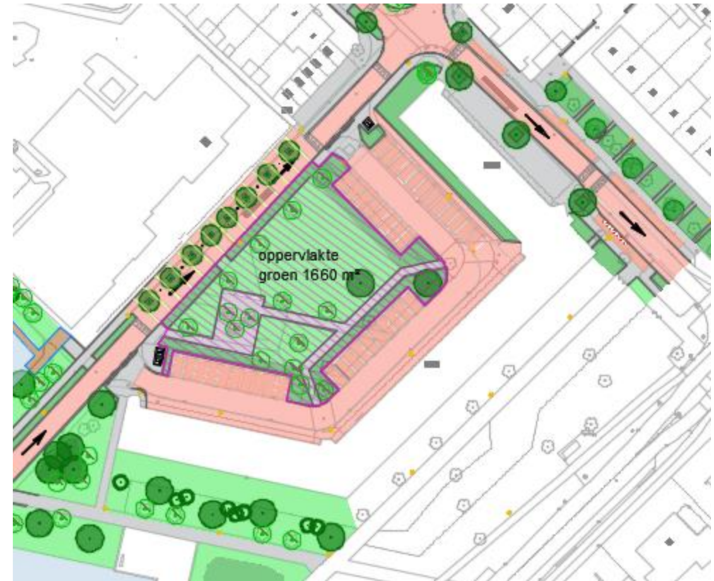
Toekomstige situatie ca 1660 m 2 groen