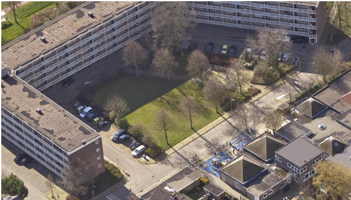
Huidige situatie ca 1700 m 2 groen