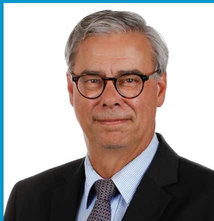
Burgemeester gemeente Waalre Voorzitter basisteam Kempen

De zorg voor veiligheid is een kerntaak van de gemeente. Die verantwoordelijkheid dragen we samen met vele partners. Veiligheid is veel omvattend en gaat om zaken waar inwoners dagelijks (bewust en onbewust) mee te maken krijgen. Denk daarbij aan veiligheid tijdens grote evenementen of de wetenschap dat de brandweer op tijd arriveert bij een brand, maar ook vervelende zaken zoals fietsendiefstal, woninginbraak, geweldpleging of de verwevenheid van de onderwereld met de bovenwereld. Veiligheid is een basisvoorwaarde voor een aantrekkelijke woon-, werken leef- gemeente en voor een goede economische en sociale ontwikkeling. De gemeente moet niet alleen veilig zijn, inwoners moeten zich ook veilig voelen.