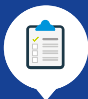
UITVOERING VAN DE KERTAKEN

WATERSCHAP BRABANTSE DELTA ZORGT VOOR VEILIGE DIJKEN EN KADES, ZUIVERT RIOOLWATER, VERBETERT EN BEWAAKT DE KWALITEIT VAN HET OPPERVLAKTEWATER EN REGELT DE HOOGTE VAN HET WATER IN MIDDEN- EN WEST-BRABANT. IN DE JAARLIJKSE BEGROTING STAAT WAT HET WATERSCHAP HET KOMENDE JAAR GAAT DOEN, WAT DAT KOST EN WAT DAT BETEKT VOOR DE BELASTINGTARIEVEN.