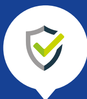
VEILIGHEID IS PRIORITEIT