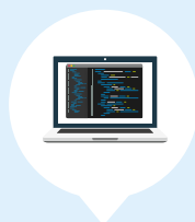
TECHNIEK & DIGITALISERING