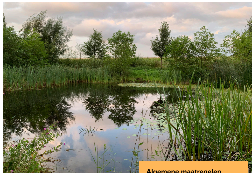
De Poel Kerkepolder bij natuurgebied de Worp is een Waterparel: een kleine plas in agrarisch gebied met veel potentie. Qua beleving een 10!

De poel ligt in een gebied waar de bever het ook goed doet. Daarnaast hopen we dat de grote modderkruiper, een beschermde soort op de rode lijst, zich meer en meer thuis gaat voelen in en rondom deze waterparel.