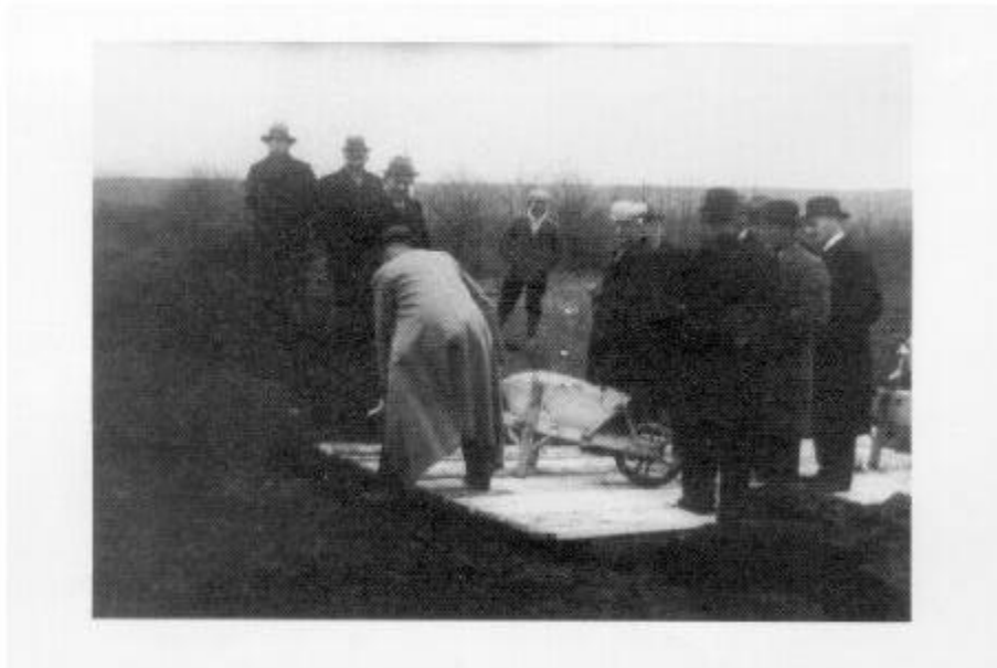
Officiële start van de verbeteringswerken in het waterschap de Gewijzigde Cruislandspolders, 1937