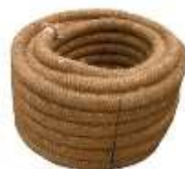
drainagebuis met kokos omhulling

--- Op de volgende pagina vindt u een voorbeeld van de schets van de afkoppelmethode ---