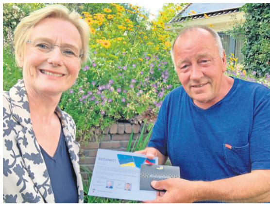
Gastgezinnen voor Oekraïense vluchtelingen kregen attentie voor hun geweldige inzet