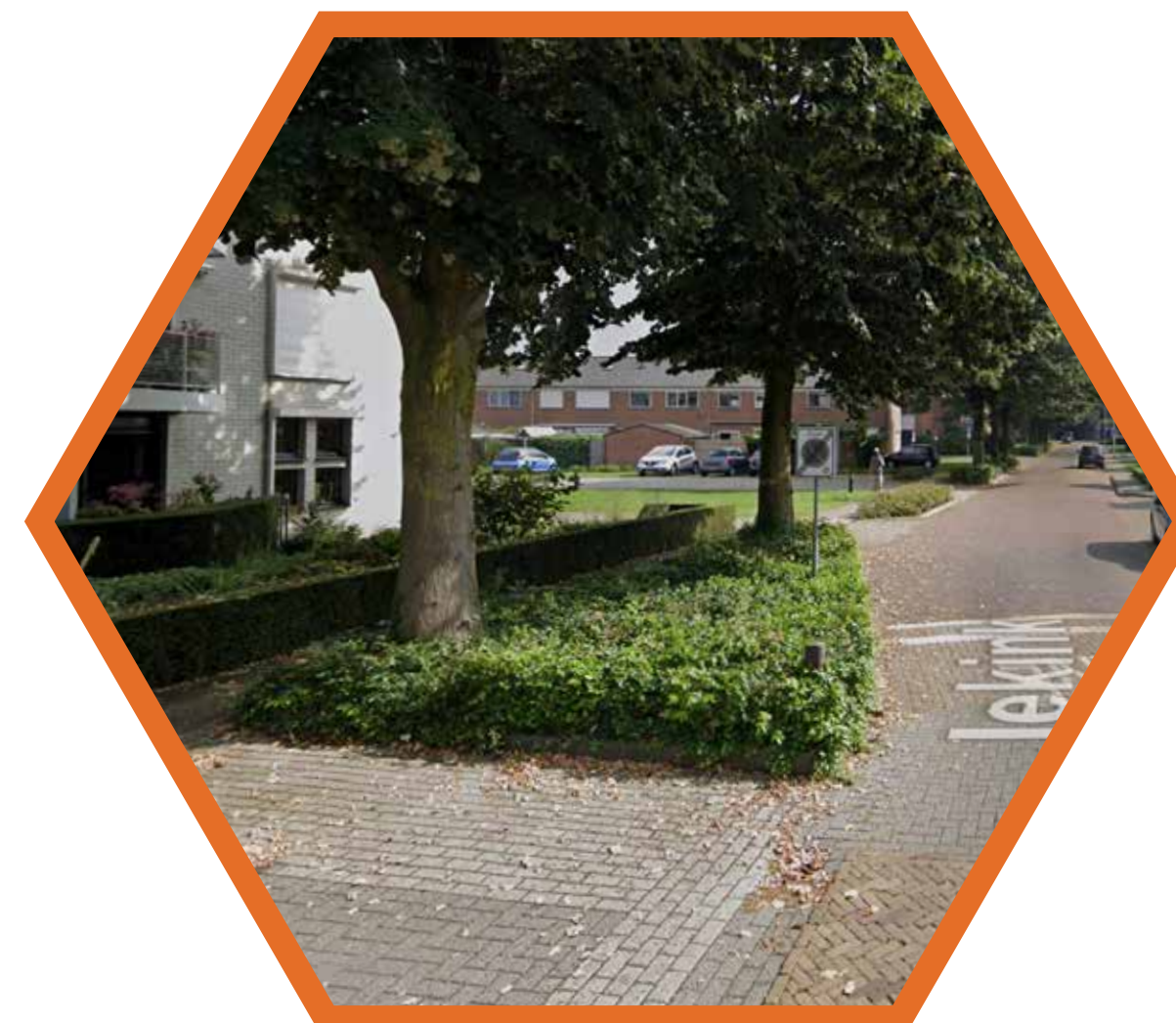
Vakbeplanting ter herkenning