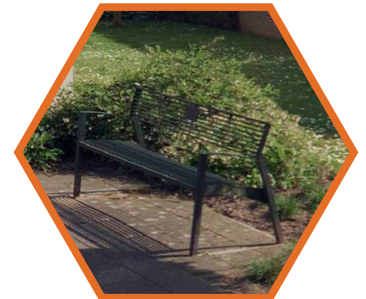
Zitbank voor ontmoetingsplek