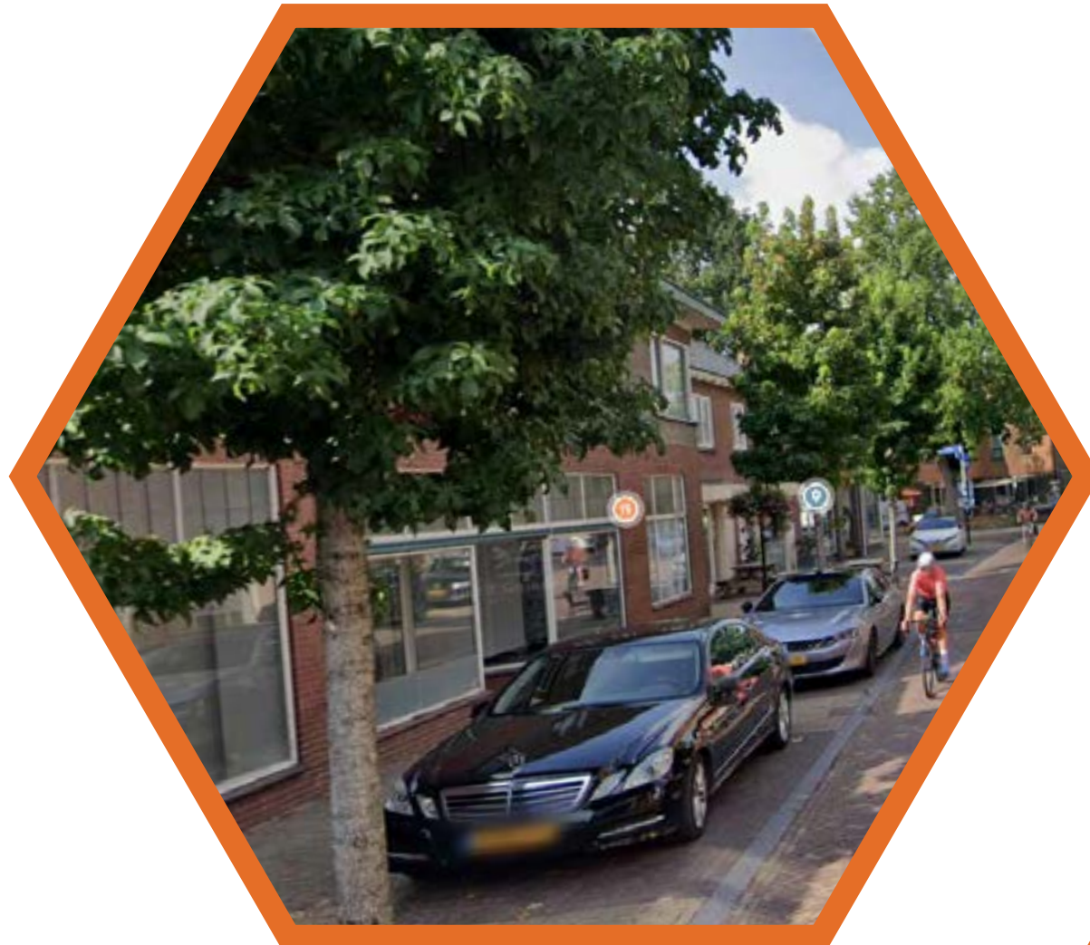
Parkeren tussen bomen