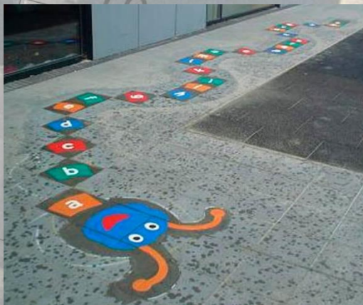
B. Pleinplakkers alfabetrups

Speeltoestellen A en C zijn geschikt voor het inclusief spelen