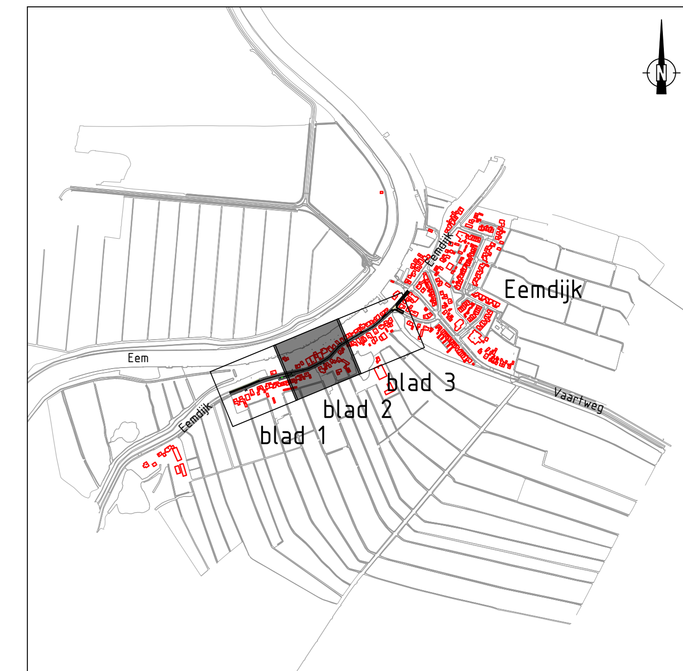
Overzicht schaal 1:10000