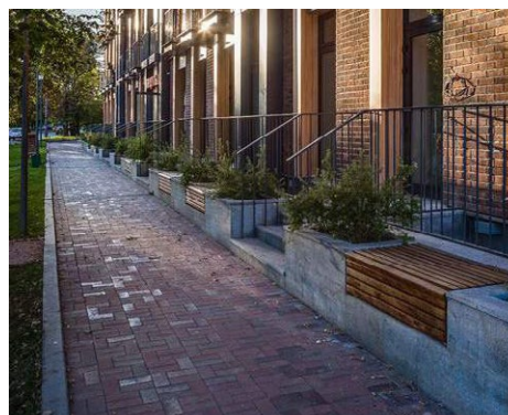
Overgangszone openbaar vs privé