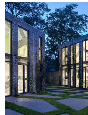
Wisselende breedte van de doorsteek door hofje en verbreding