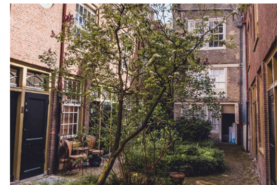
Doorsteken aangenaam en verrassend