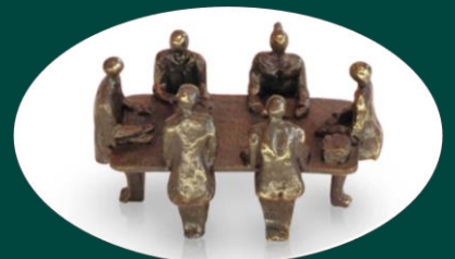
bron: arteaux beeld 'de vergadering'

En er staat een flap over: Als u wilt kunt u onderwerpen noteren die u mist. Of tips waar wij in de uitwerking rekening mee moeten houden.