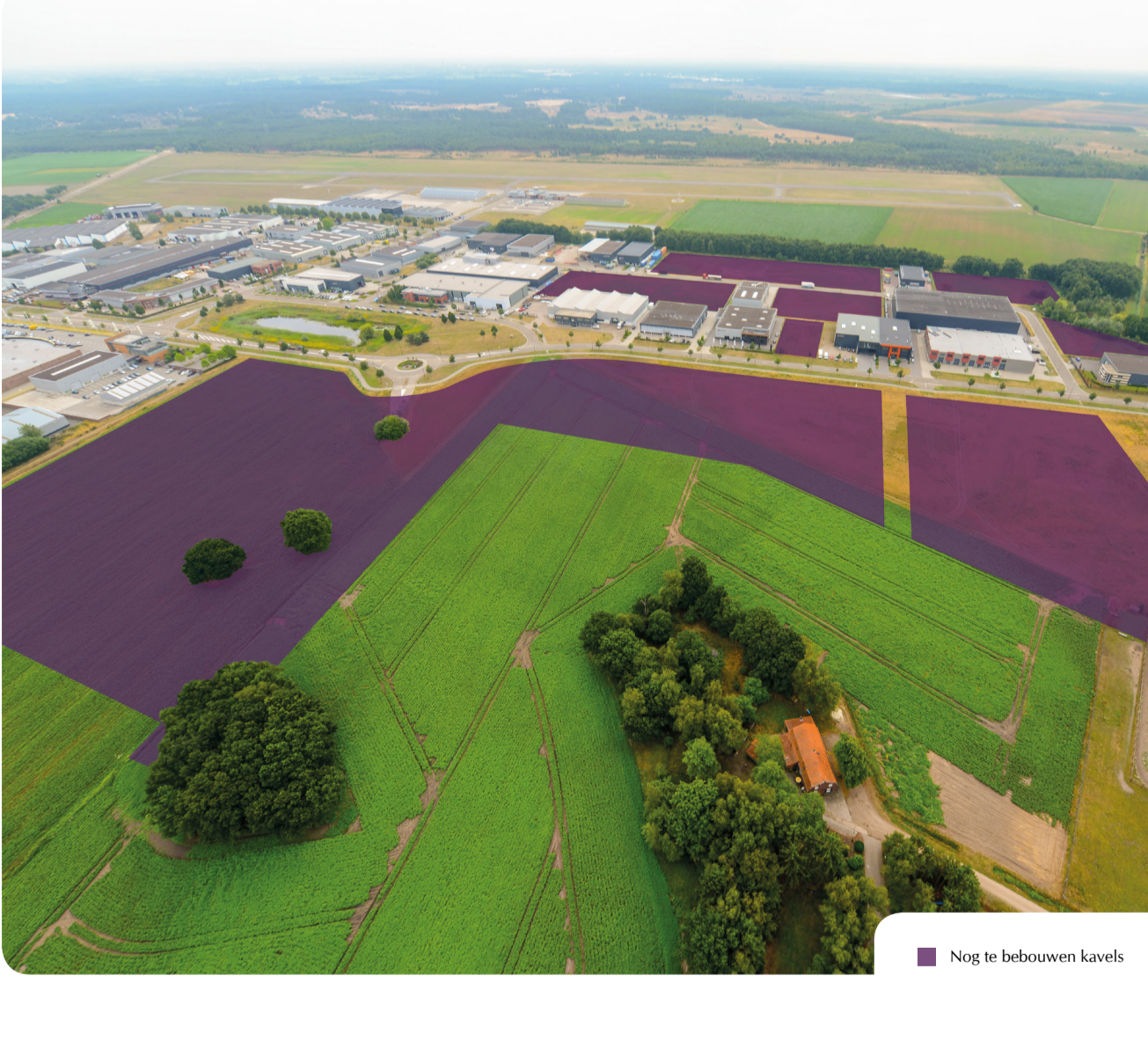
■ Nog te bebouwen kavels

Monique Janssen Tel: 14 0495 (vanuit het buitenland: 0031 495 431222) Mob.: 06 228 207 99 E-mail: m.janssen@cranendonck.nl Website: www.cranendonck.nl