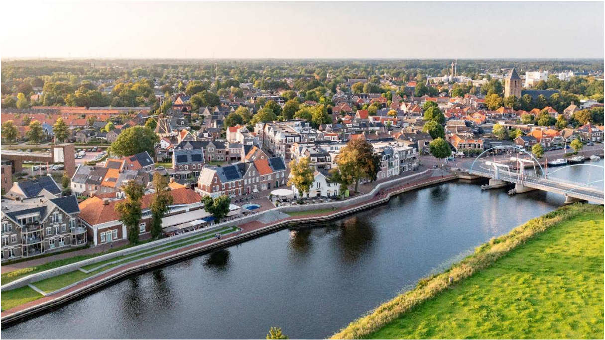
- Dalfsen Centrum -