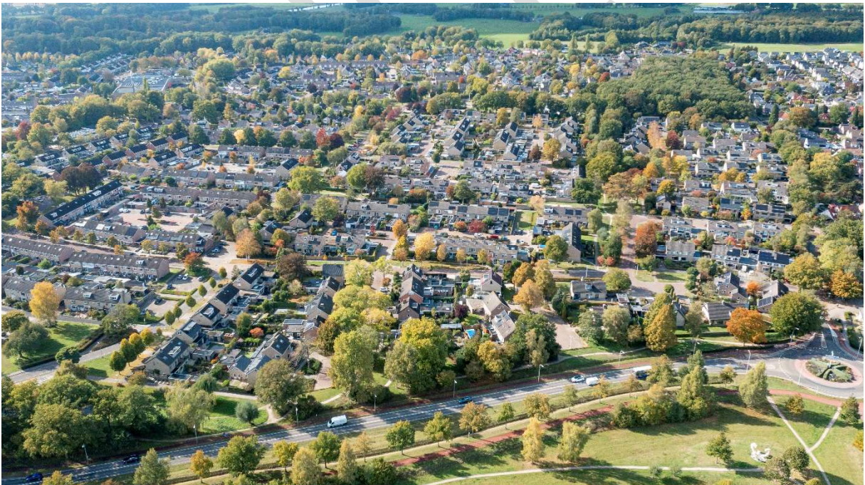
- Polhaar -