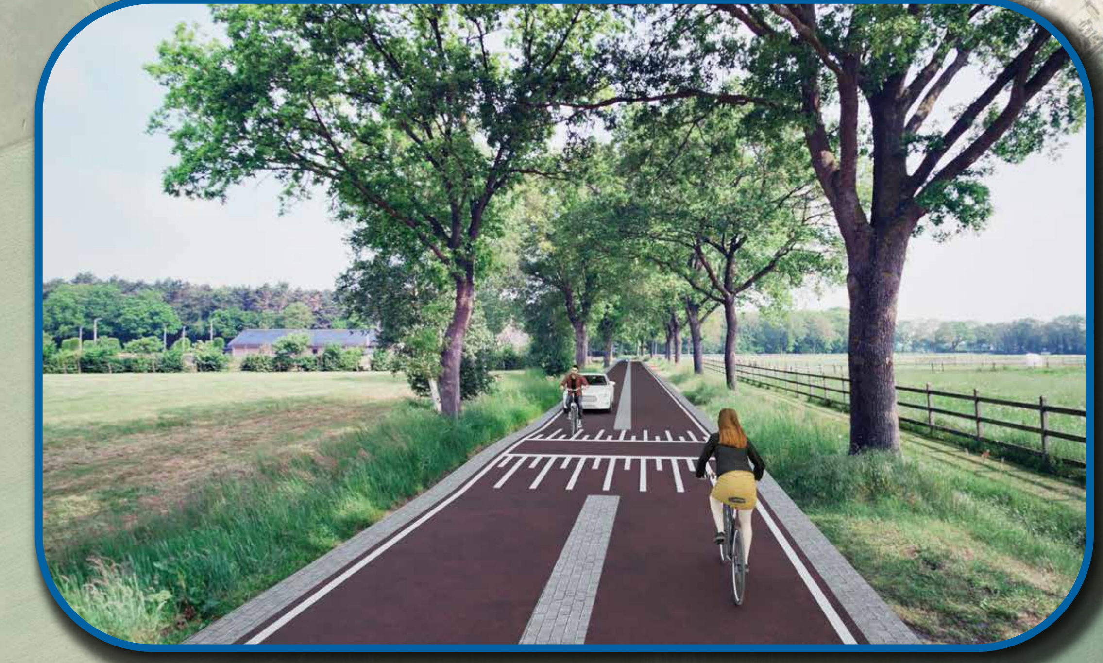
visualisatie drempel in fietsstraat