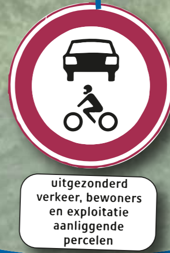
uitgezonderd verkeer, bewoners en exploitatie aanliggende percelen