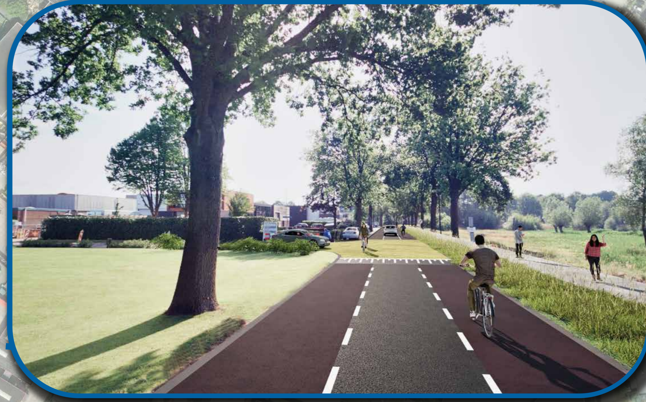
visualisatie rijbaan met fietsstroken ter hoogte van de Goldkampstraat