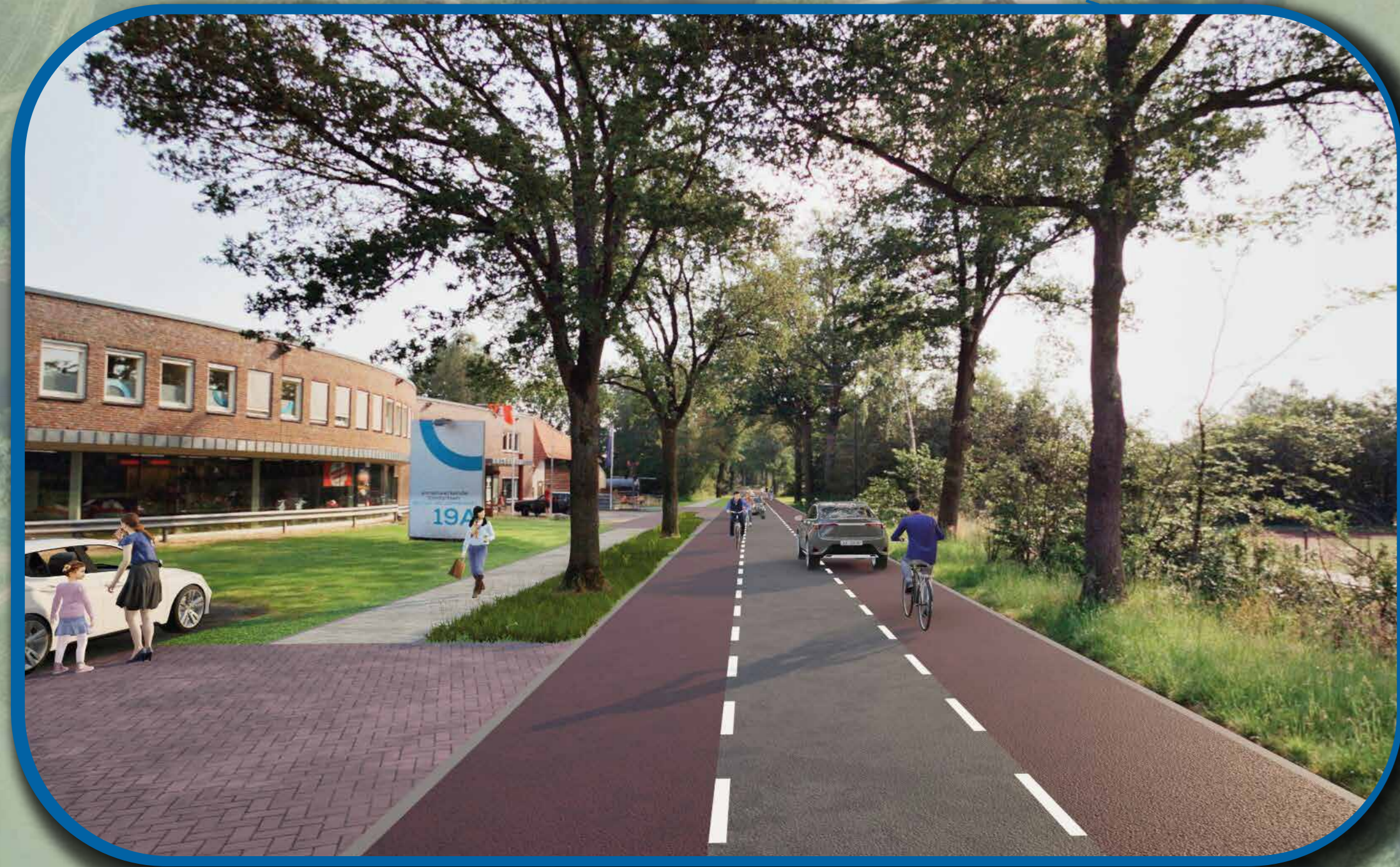
visualisatie rijbaan met fietsstroken ter hoogte van Van der Stouwe