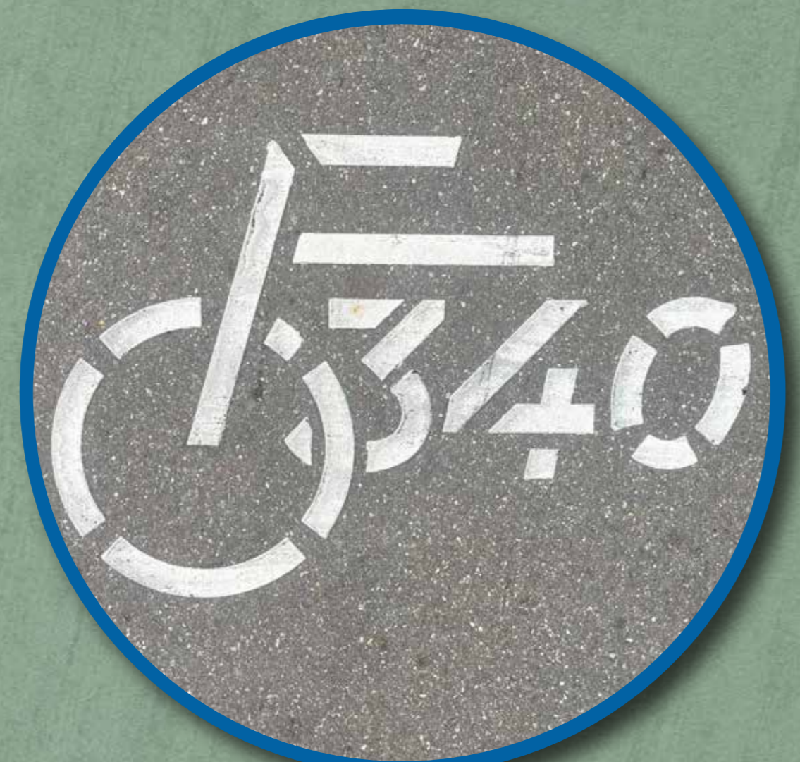
F340 logo op wegdek