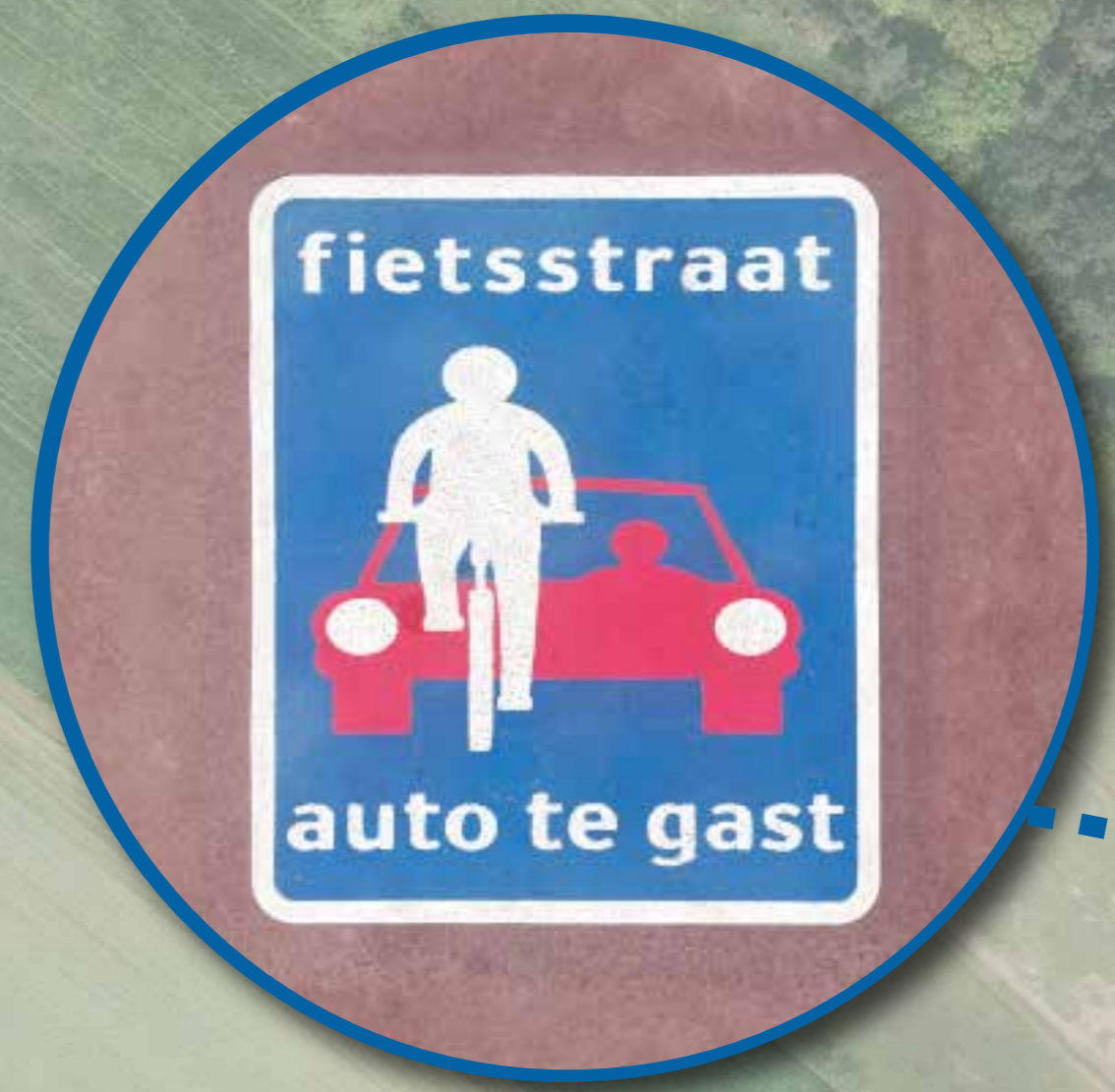
Fietsstraat symbool op wegdek bij begin van de fietsstraat