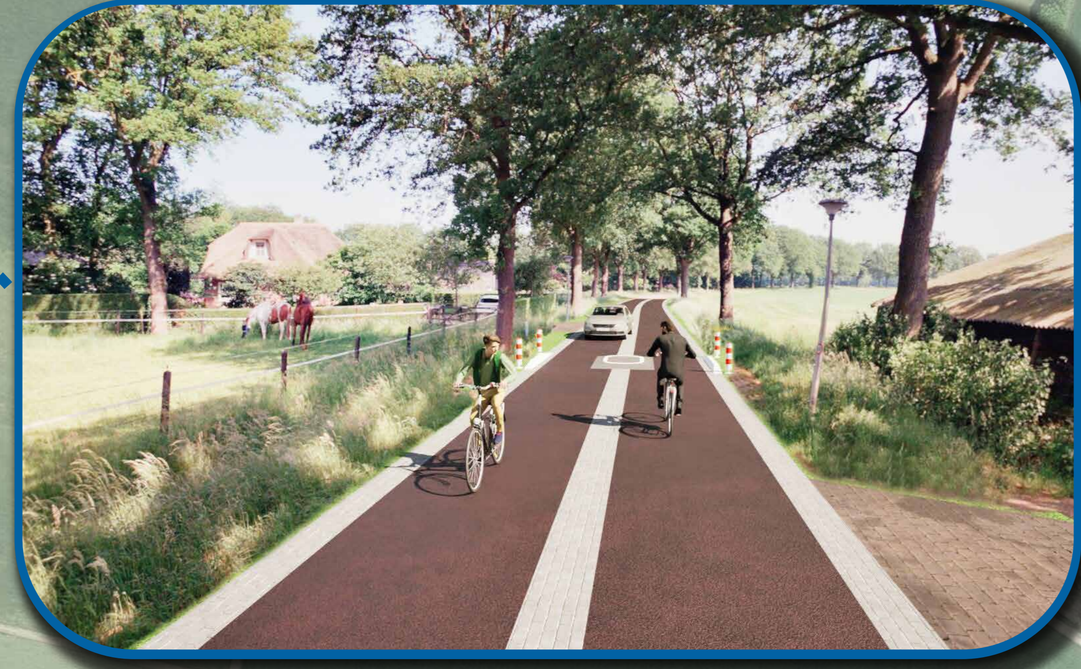
visualisatie busvriendelijke drempel