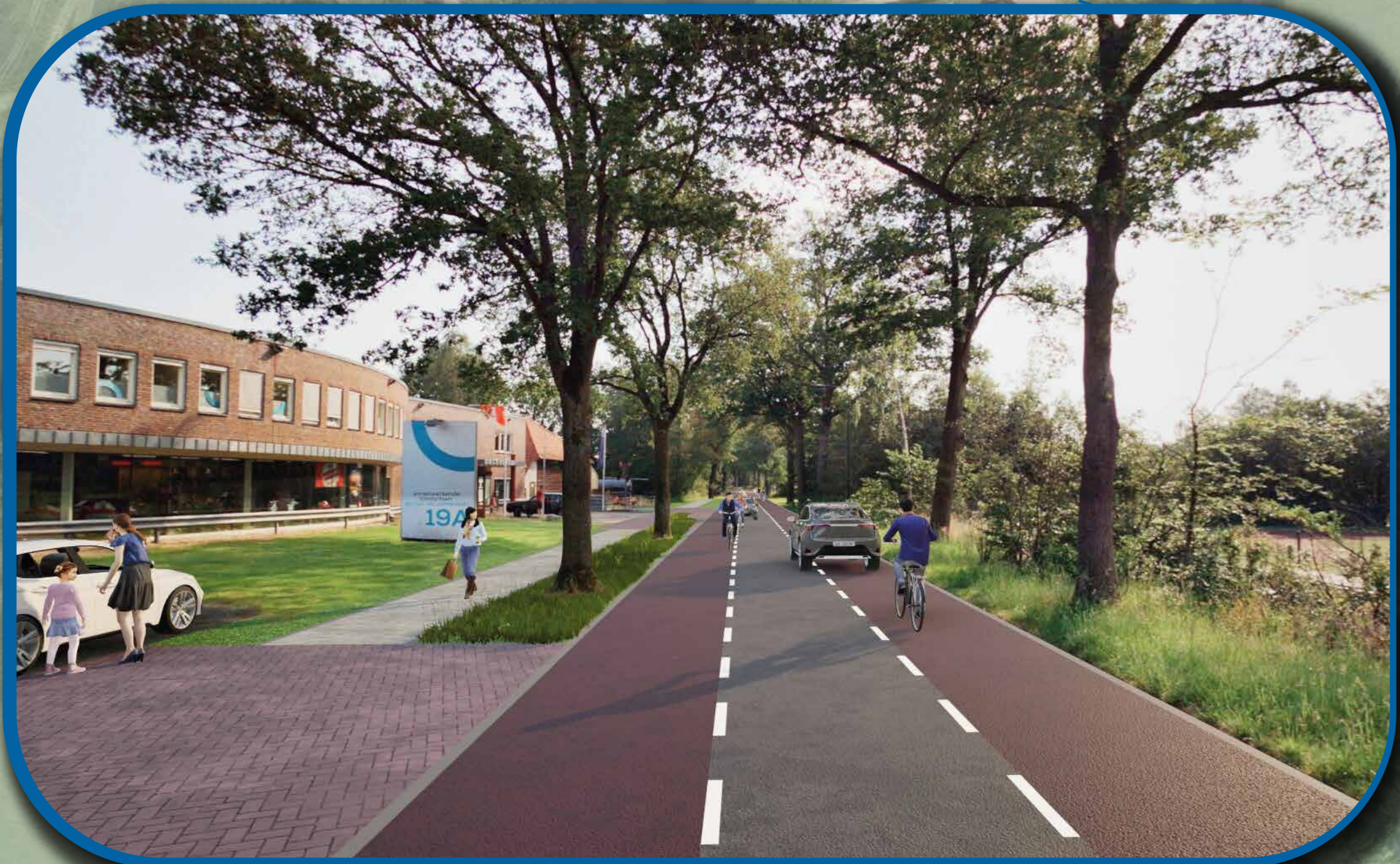
visualisatie rijbaan met fietssuggestiestroken ter hoogte van Van der Stouwe