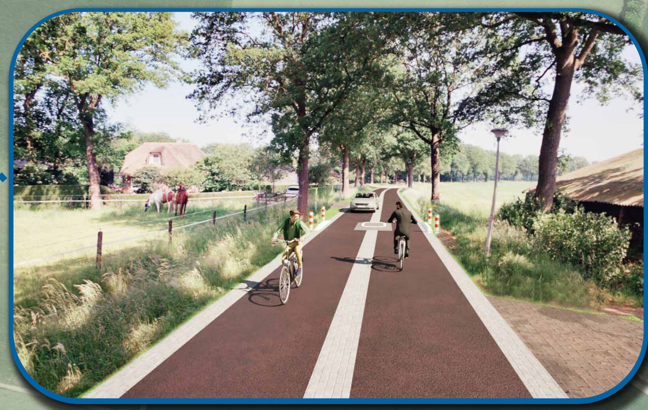
visualisatie voor landbouwvoertuigen vriendelijke drempel