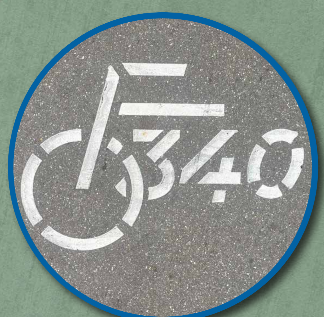
F340 logo op wegdek