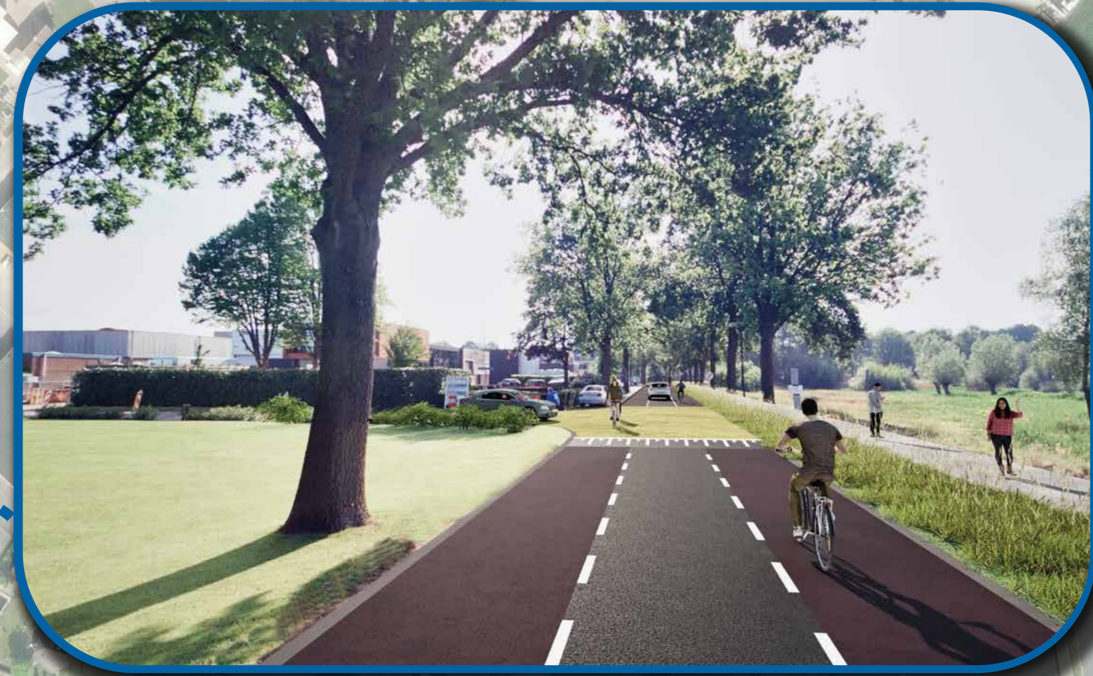
visualisatie rijbaan met fietssuggestiestroken ter hoogte van de Goldkampstraat