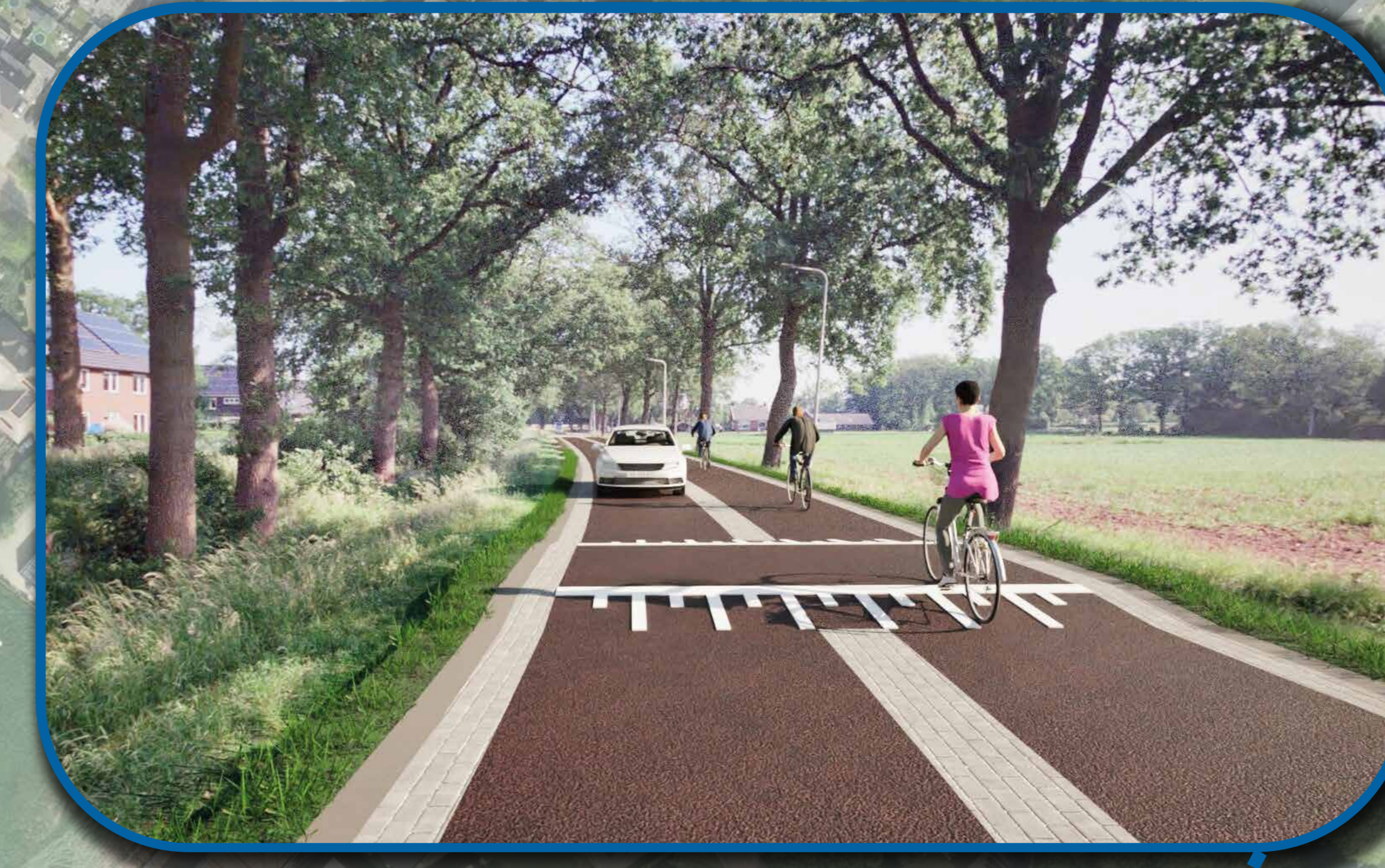
visualisatie fietsstraat binnen de bebouwde kom ter hoogte van de straat Middelleeuwen