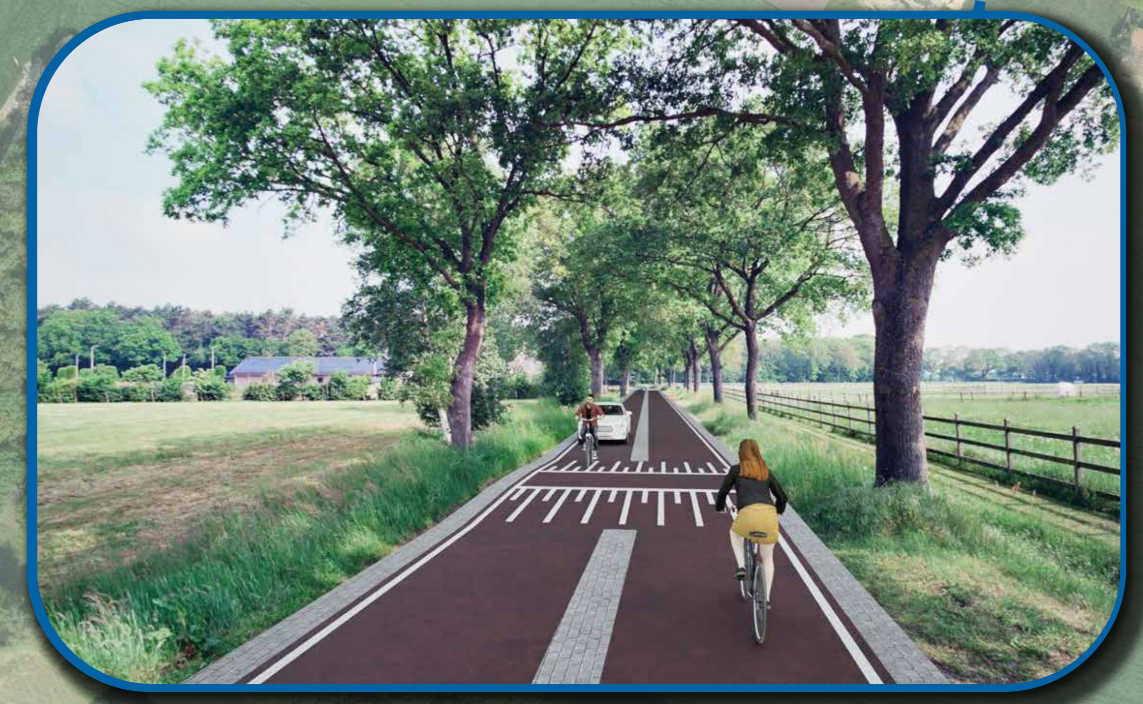
visualisatie drempel in fietsstraat