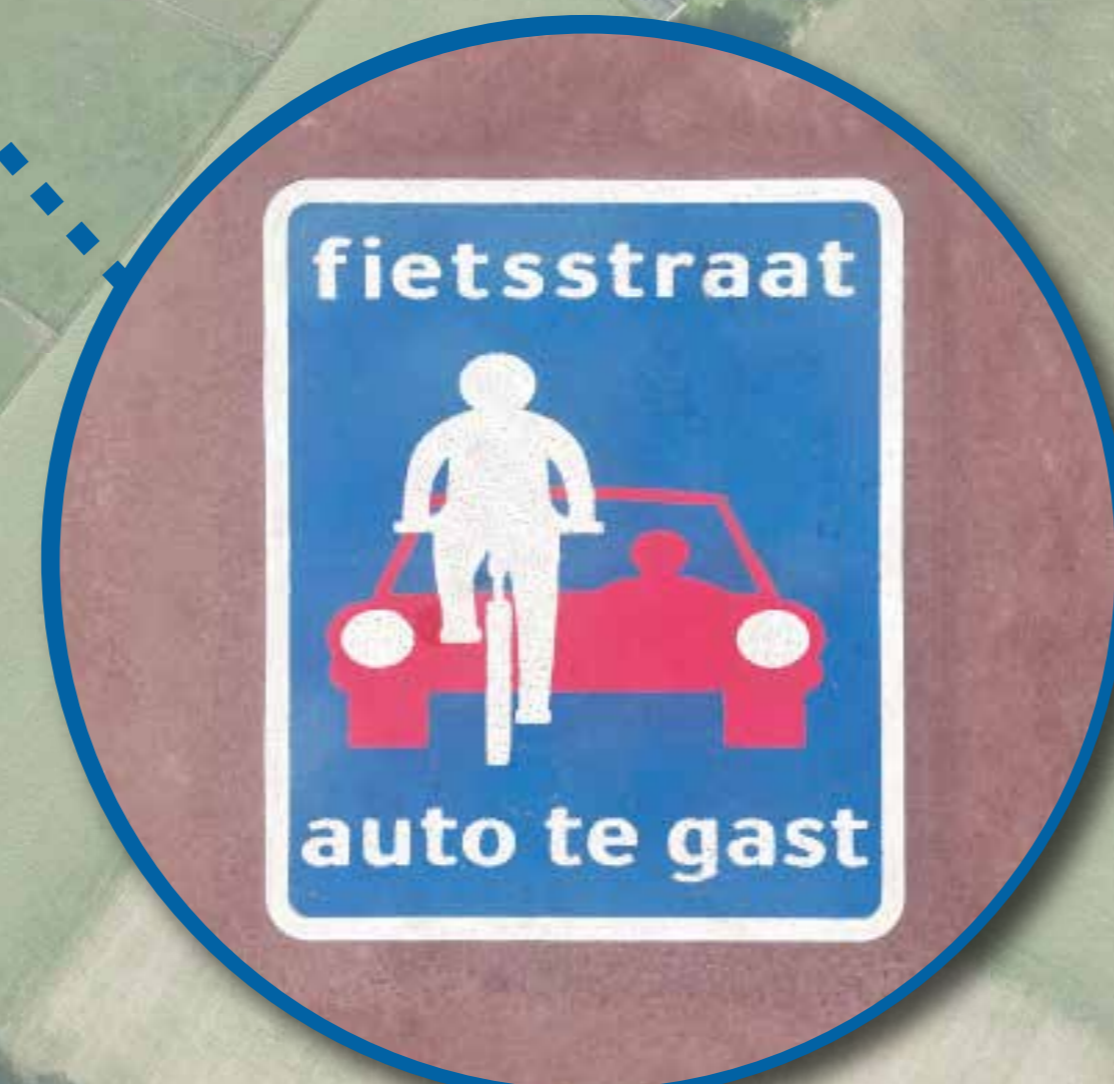
Ter hoogte van De Singel overgang naar fietsstraat, aangeduid met 'fietsstraat' symbool op het wegdek