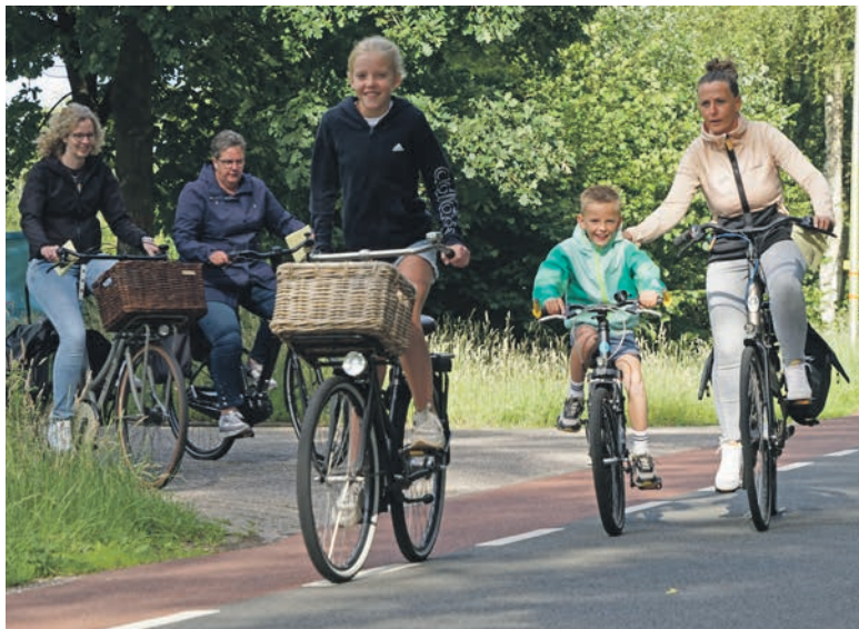
De fietsdriedaagse.

Ook dit jaar kan iedereen meedoen aan de Dalfser 'triatlon', bestaande uit de Wandel3daagse, Fiets3daagse en Zwem4daagse. Of u nu fanatiek sport, af en toe beweegt of samen met uw (klein)kinderen wilt deelnemen: de Datrion is er voor iedereen en u kiest zelf hoeveel dagen u meedoet. Op 3, 4, en 5 juni start de Datrion met de Wandel3daagse.