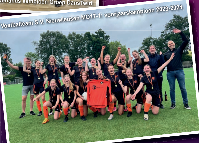
Voetbalteam S.V. Nieuwleusen MO17-1: voorjaarskampioen 2023-2024