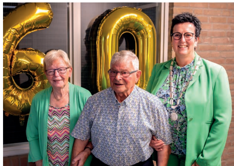
Echtpaar Melenhorst uit Heino (voorheen Hoonhorst).