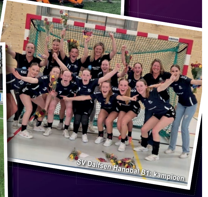
SV Dalfsen Handbal B1: kampioen