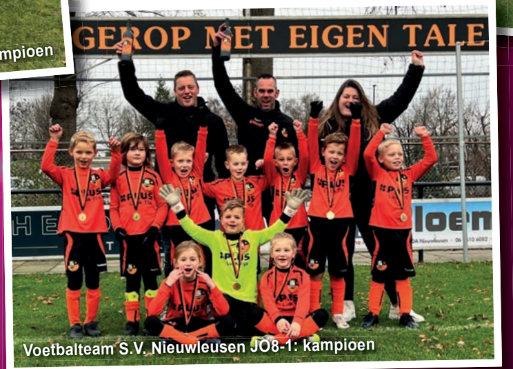
Voetbalteam S.V. Nieuwleusen JO8-1: Kampioen