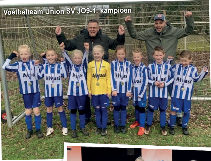
Voetbalteam Union SV JO9-1: kampioen