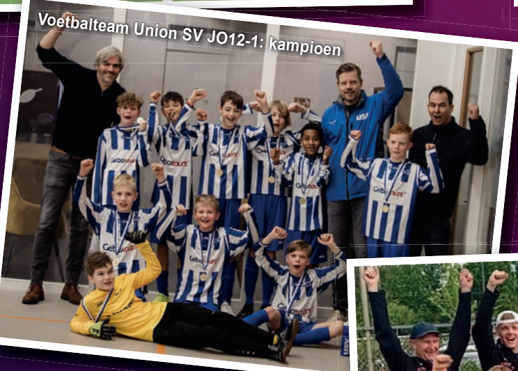
Voetbalteam Union SV JO12-1: kampioen