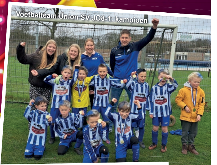
Voetbalteam Union SV JO8-1: kampioen