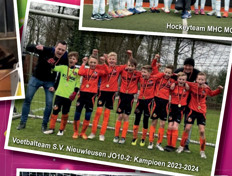
Voetbalteam S.V. Nieuwleusen JO10-2: Kampioen 2023-2024