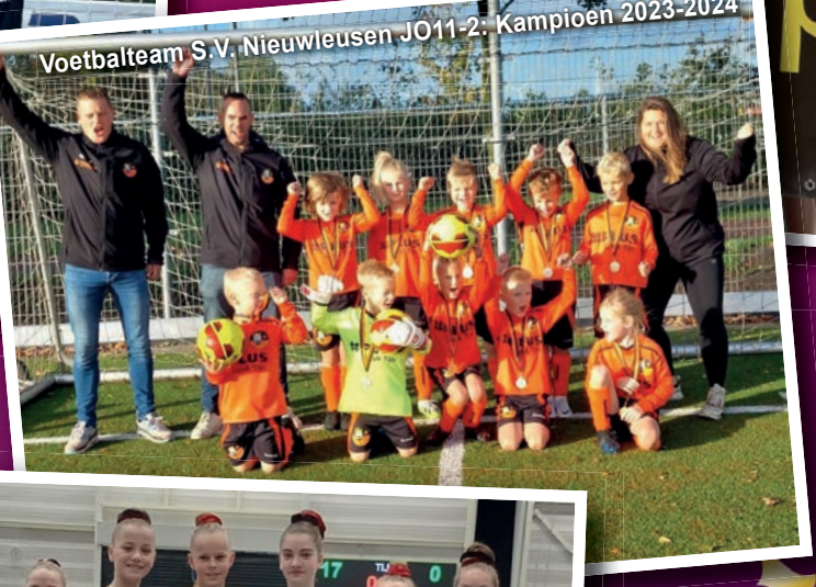
Voetbalteam S.V. Nieuwleusen JO11-2: Kampioen 2023-2024