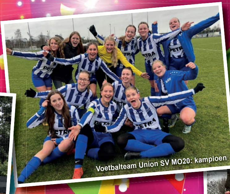
Voetbalteam Union SV MO20: kampioen