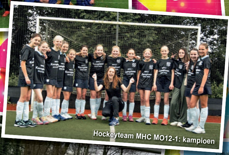
Hockeyteam MHC MO12-1: kampioen