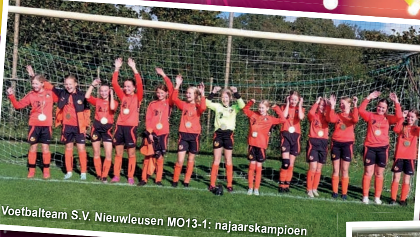
Voetbalteam S.V. Nieuwleusen MO13-1: najaarskampioen