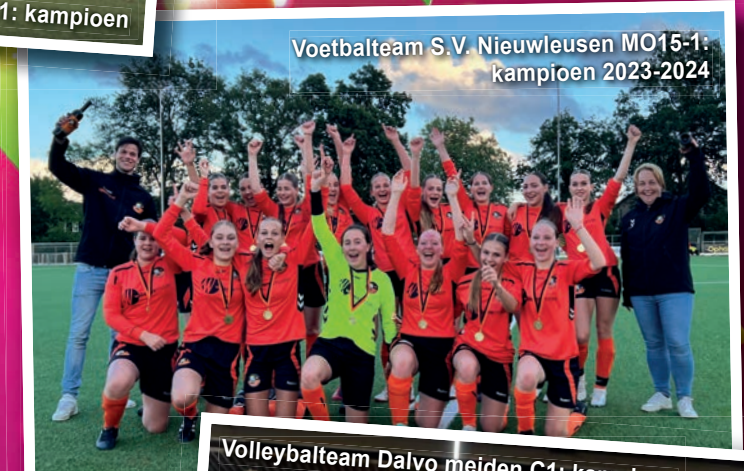
Voetbalteam S.V. Nieuwleusen MO15-1: kampioen 2023-2024