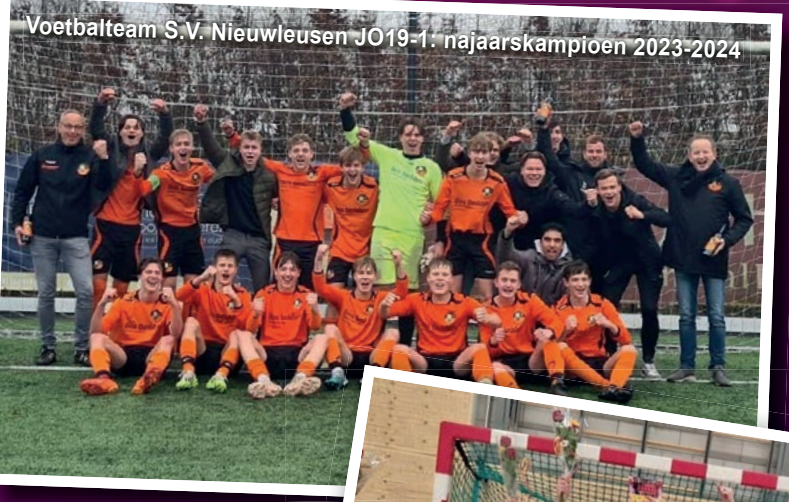
Voetbalteam S.V. Nieuwleusen JO19-1: najaarskampioen 2023-2024