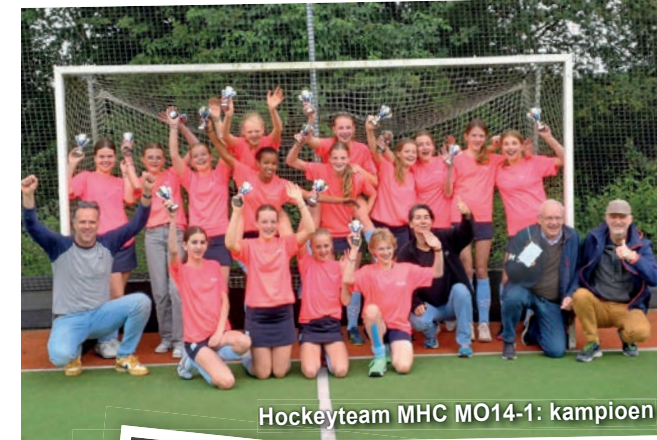
Hockeyteam MHC MO14-1: kampioen