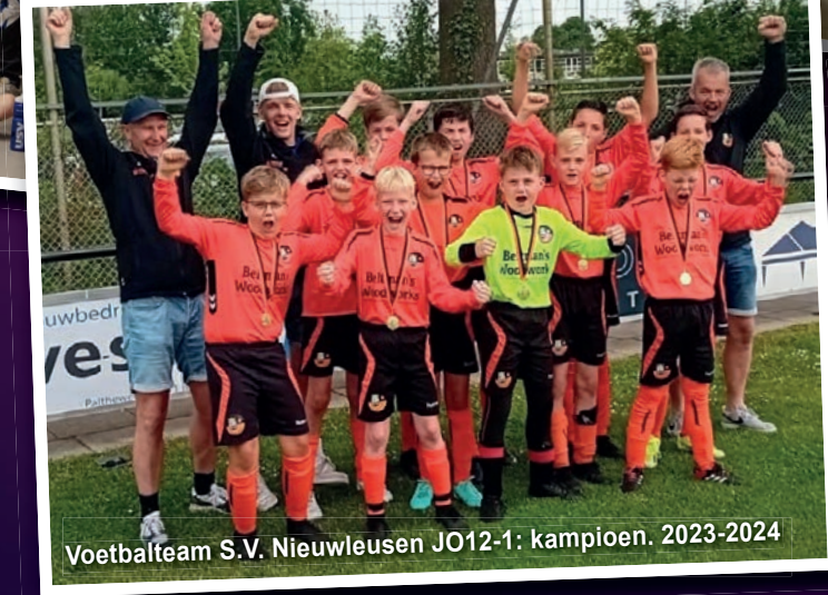
Voetbalteam S.V. Nieuwleusen JO12-1: kampioen. 2023-2024