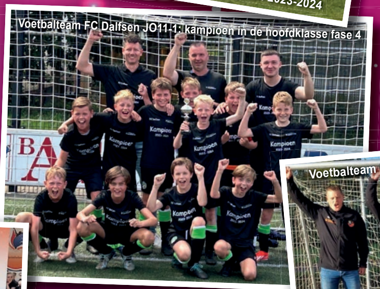
Voetbalteam FC Dalfsen JO11-1: kampioen in de hoofdklasse fase 4