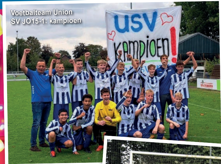
Voetbalteam Union SV JO15-1: kampioen