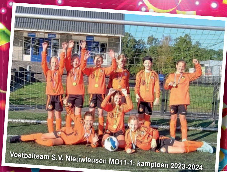
Voetbalteam S.V. Nieuwleusen MO11-1: Kampioen 2023-2024

Ook jeugdkampioen? Twee keer per jaar feliciteren we de jeugdkampioenen in de gemeente Dalfsen. Verenigingen, teams en individuen kunnen zich hiervoor zelf aanmelden. Kijk voor de voorwaarden en het aanmeldformulier op: www.dalfsen.nl/sportbuitendagen