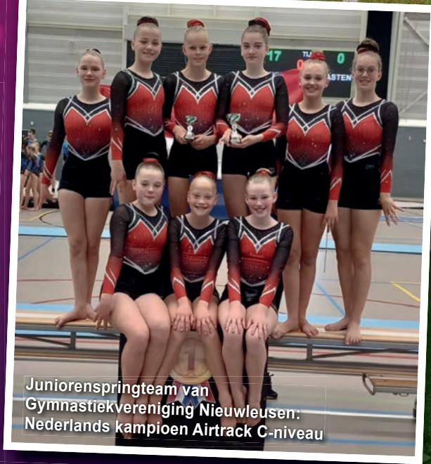
Juniorenspringteam van Gymnastiekvereniging Nieuwleusen: Nederlands kampioen Airtrack C-niveau