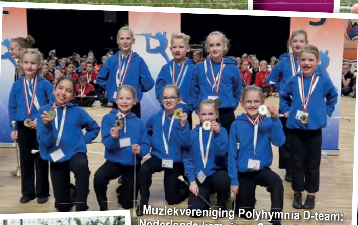
Muziekvereniging Polyhymnia D-team: Nederlands kampioen Groep DansTwirl