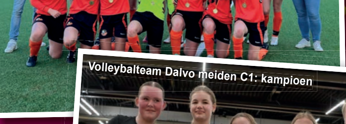
Volleybalteam Dalvo meiden C1: kampioen