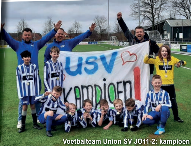
Voetbalteam Union SV JO11-2: kampioen