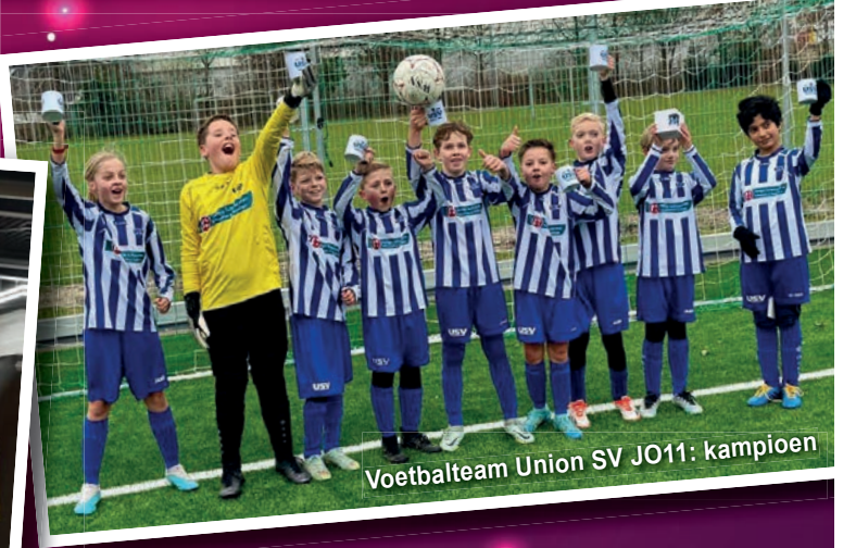
Voetbalteam Union SV JO11: kampioen