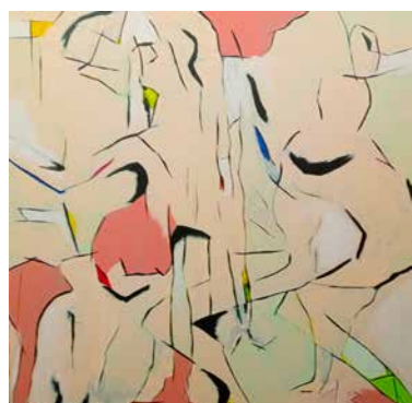
Het werk 'Distraction' van kunstenaar Bart Stevens.

Van vrijdag 27 september tot en met dinsdag 5 november 2024 exposeert Bart Stevens met kleurrijke schilderijen, tekeningen en beelden in de foyer van het gemeentehuis in Dalfsen. Het werk is te bekijken tijdens openingstijden van het gemeentehuis. Deze vindt u op www.dalfsen.nl .