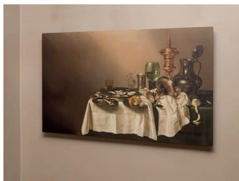
Op de foto ziet u een infraroodpaneel, maar het lijkt een schilderij.