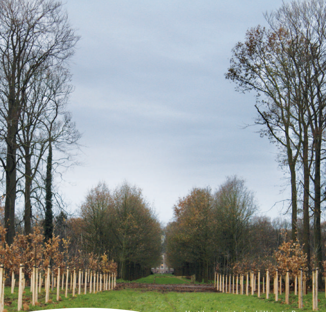
Herstel van lanenstructuur bij Huize den Berg