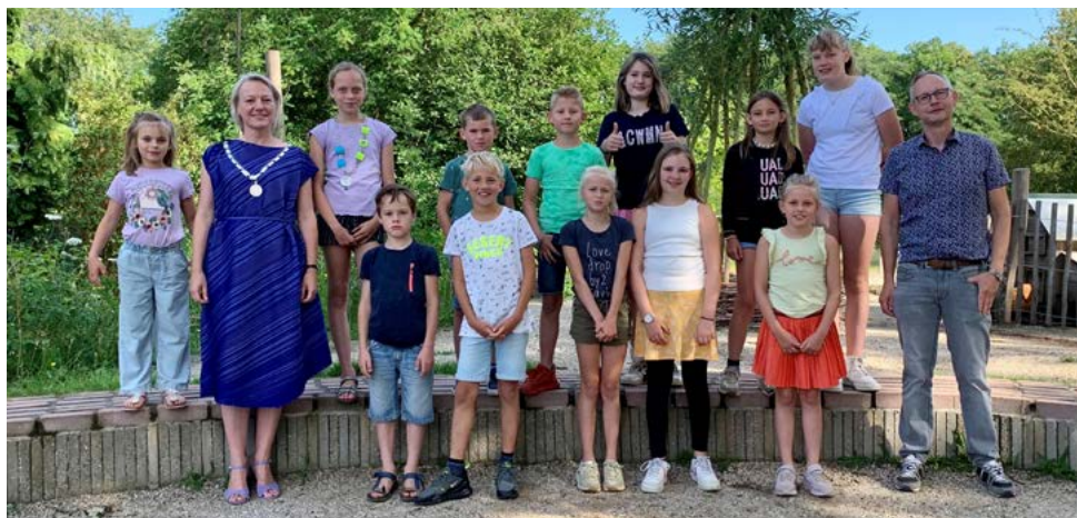
Op de foto basisschool St. Cyriacus uit Hoonhorst.

De burgemeester en kinderburgemeester kijken terug op een gezellige ochtend waar ze veel kinderen hebben mogen spreken. Aan de scholen: bedankt voor de gastvrijheid!