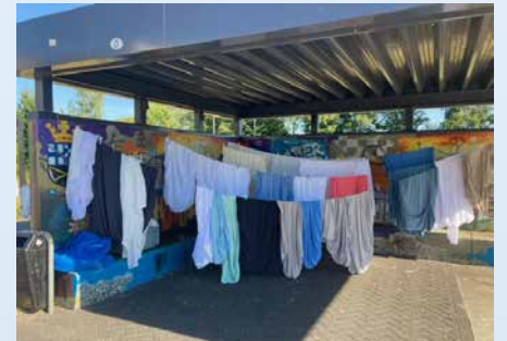
Afgelopen donderdag was het wasdag bij de opvanglocatie.