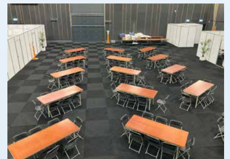
Bovenstaande 3 foto's geven een beeld van de inrichting in De Spil. De foto's zijn genomen voorafgaand aan de komst van de asielzoekers.