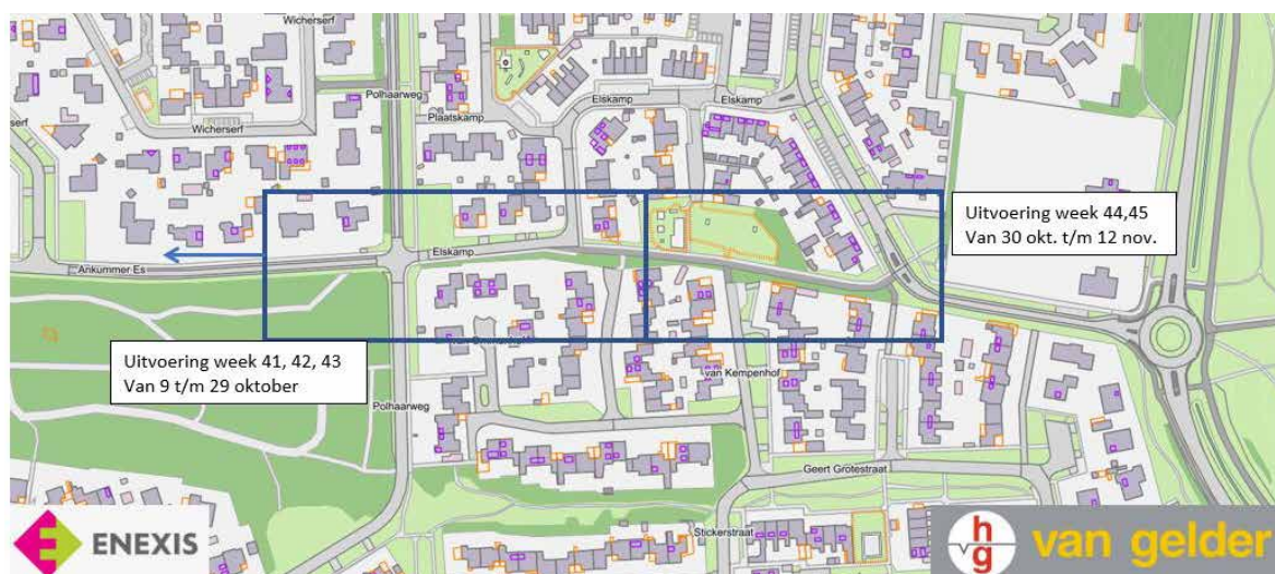
Planning uitvoering kabels en leidingen

omleidingen, harde werkgeluiden en meer vrachtverkeer. Meer info op de site via www.Dalfsen.nl