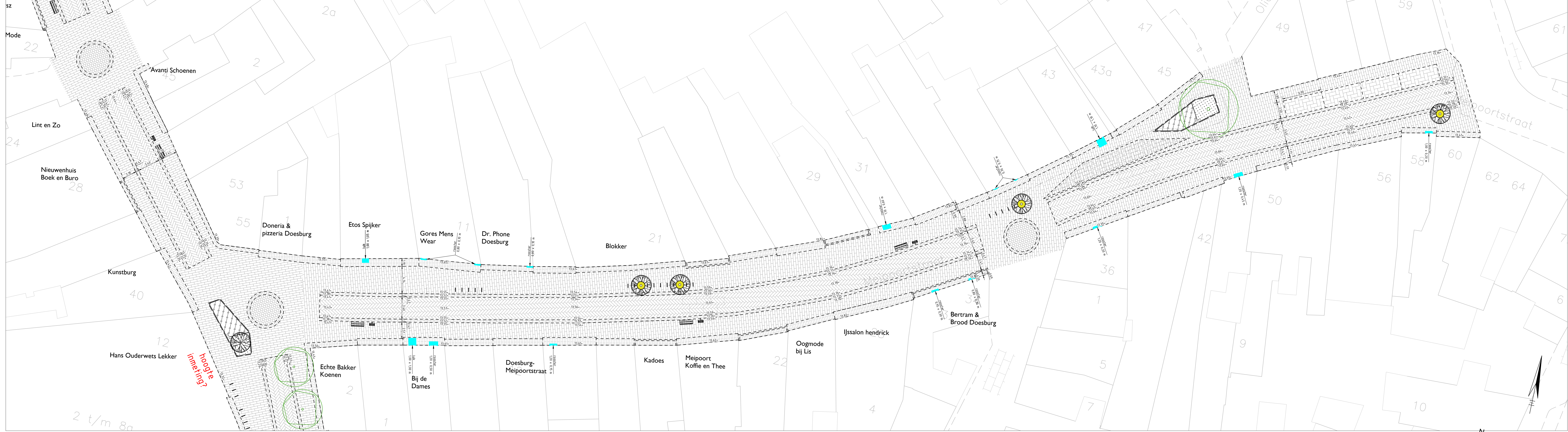
Kader C-C, schaal 1:200