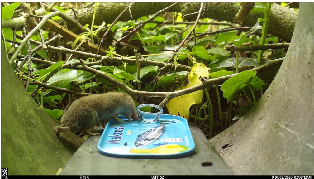
Foto 9 t/m 11. Selectie van camerabeelden van muizen vanuit de Struikrover cameraval.