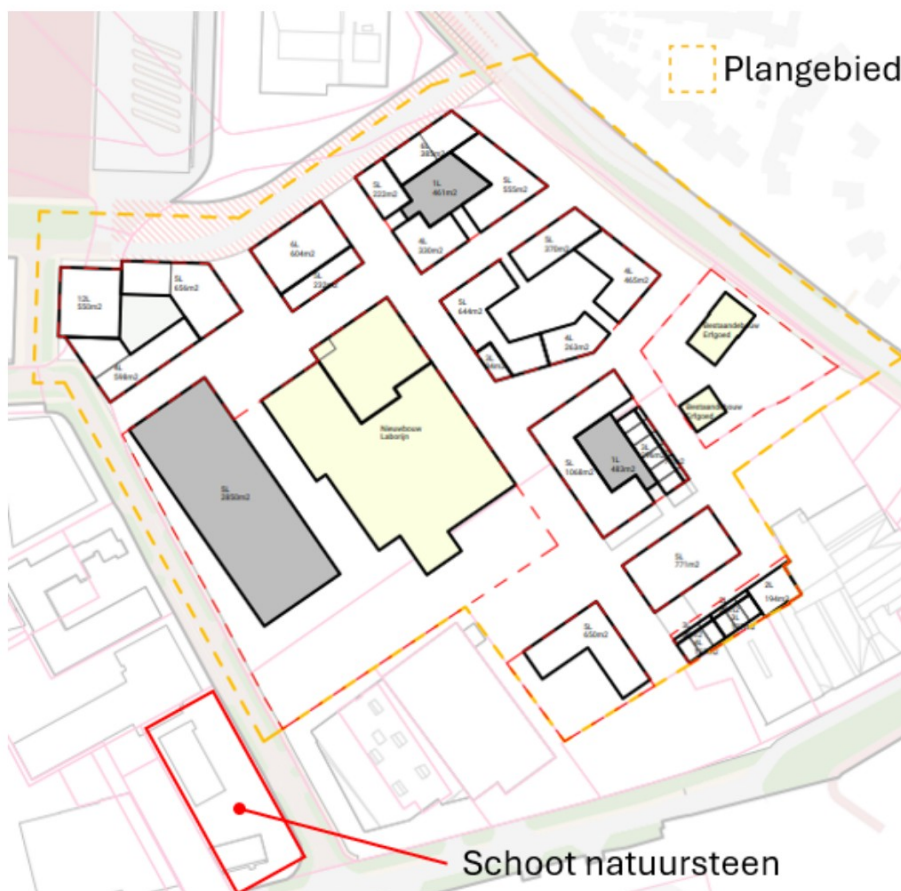
figuur 1: weergave plangebied en ligging Schoot Natuursteen

In onderstaand figuur is Schoot Natuursteen samen met het plangebied weergegeven.