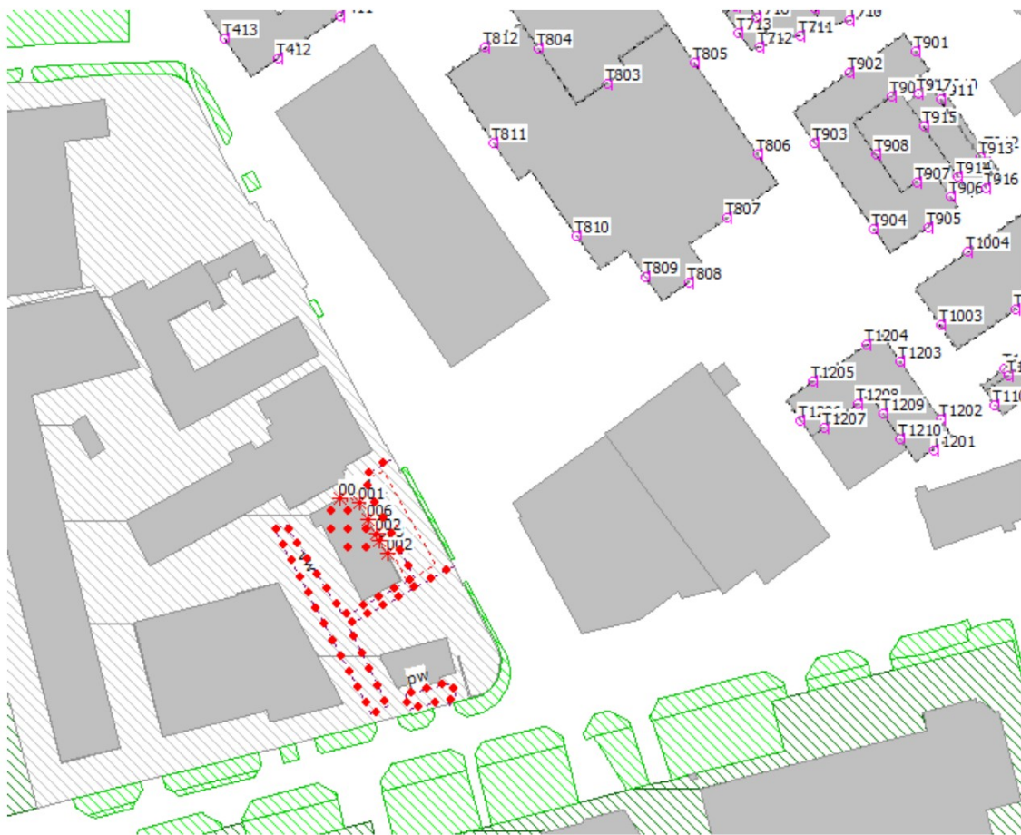
figuur 3: overzicht rekenmodel L_{A,r,LT}

Het plan omvat meerdere appartementen met verschillende bouwhoogtes. We hebben beoordelingspunten geplaatst tot 35 meter hoog.