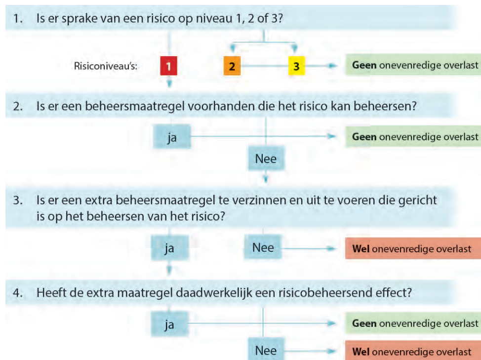
Figuur 2.3: stroomschema monitoring door beheergroep

Belangrijk is dus dat in geval van onevenredige overlast gekeken wordt naar extra of alternatieve maatregelen die de overlast beter kunnen beheeren. Deze alternatieve maatregelen kunnen in ieder geval gevonden worden in de opschaaloplossingsrichtingen, maar mogelijk zijn gaandeweg de exploitatie ook nieuwe maatregelen ter beschikking gekomen die ingezet kunnen worden. Dit geldt echter ook andersom: als blijkt dat er met minder maatregelen hetzelfde overlastniveau kan worden gerealiseerd, kunnen maatregelen eventueel ook worden afgebouwd. Dit is naar onze mening de essentie van dynamisch beheer.