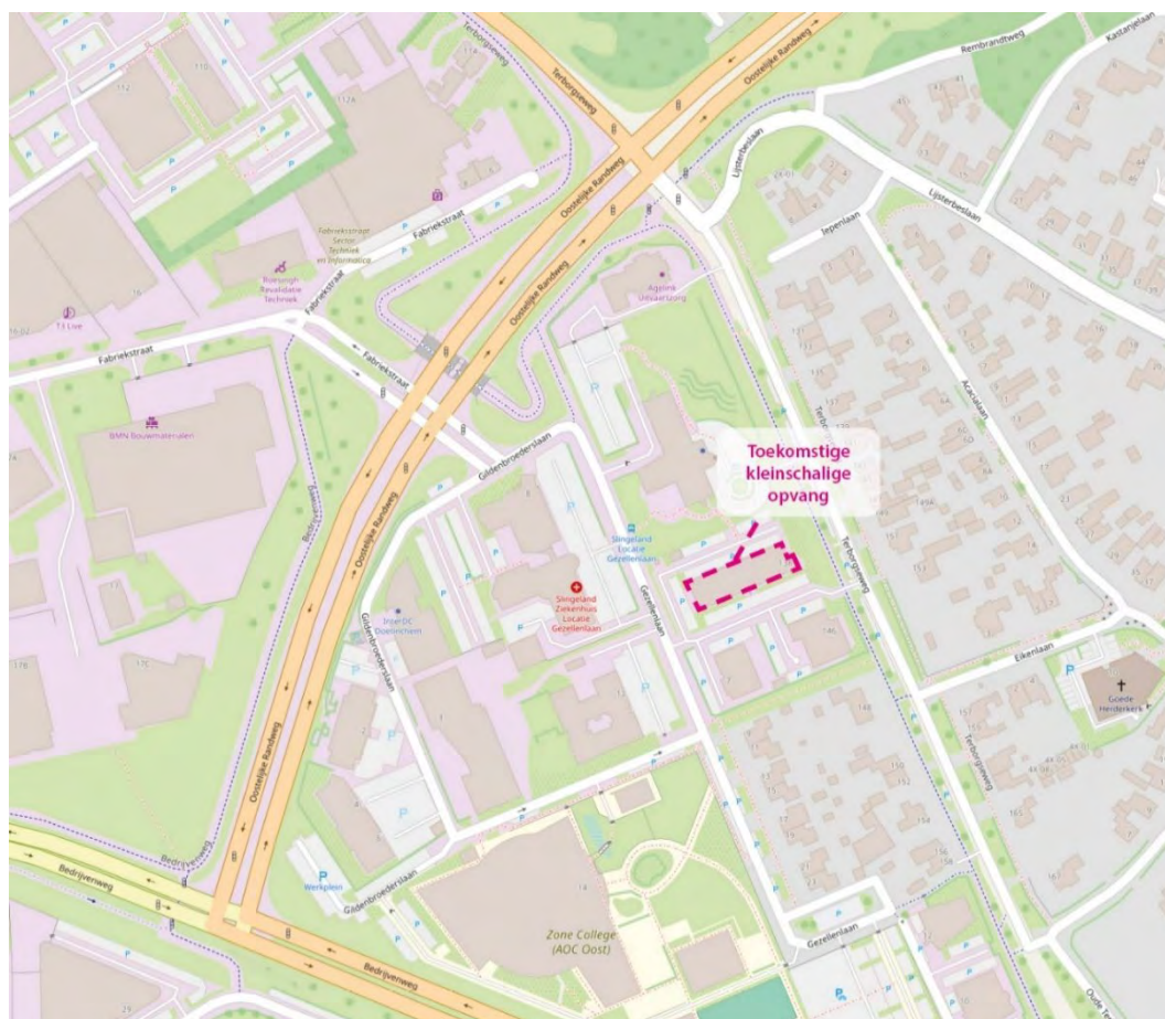
Afbeelding 1.1: Luchtfoto met daarop het pand van de toekomstige kleinschalige opvanglocatie

Aan de Terborgseweg 138 in Doetinchem wil het COA een kleinschalige opvanglocatie openen voor 50 alleenstaande minderjarige vreemdelingen (amv'ers) en 50 reguliere asielzoekers. Het betreft een terrein waarop voor drie jaar huisvesting aan deze groep wordt gerealiseerd. Het leegstaande kantoorpand dat is gelegen aan de Terborgseweg 138 zal hiervoor worden ingericht. De omgeving kenmerkt zich als een gemengd gebied met bedrijven, woningen en maatschappelijke voorzieningen. Zo is er in de buurt een bedrijventerrein gevestigd, een middelbare school, een mbo-instelling, een vestiging van het Slingeland ziekenhuis, een woonwijk en kantoren met maatschappelijke functies. Iets verder weg ligt onder andere een voetbalstadion.