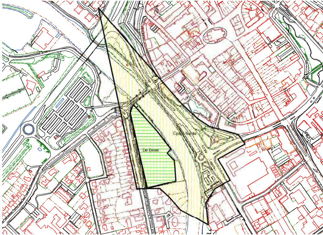
Figuur 1 plattegrondtekening van het evenementen terrein De Bleek met de eromheen liggende open ruimte. Groen horizontaal gestreept is het evenementen terrein De Bleek. Geel verticaal is de open ruimte tussen geluidgevoelige bestemmingen (o.a. woningen).

Om contouren aan te kunnen geven waarbinnen een muziekinstallatie met een bepaald bronvermogen mag komen te staan is in relatie met de 70 dB(A) grens de afstand berekend. In Tabel 2 zijn de rekenresultaten weergegeven.